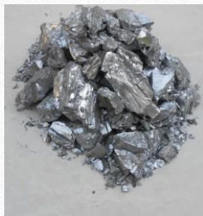
Характерные степени окисления хрома