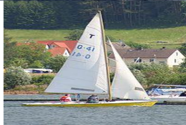
Гоночные классы Л6, катамаран Торнадо и Темпест