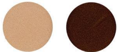
5. Кремовый жемчуг\ Коричневый топаз