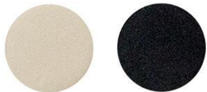
4. Белый жемчуг\ Чёрный агат