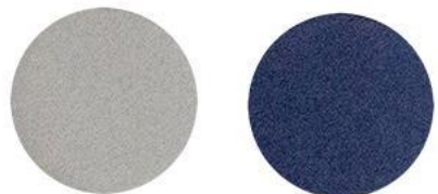
2. Серебро/ Сапфир