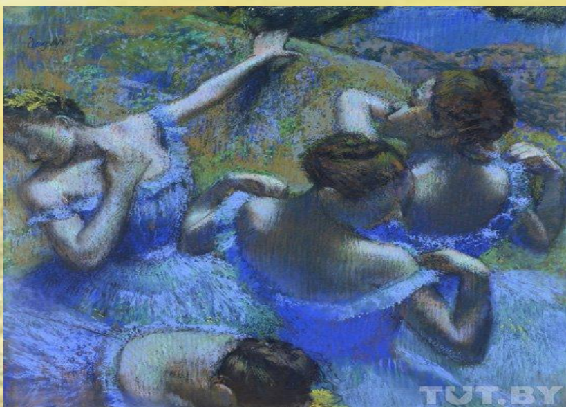
Э.Дега «Танцовщицы в голубом»