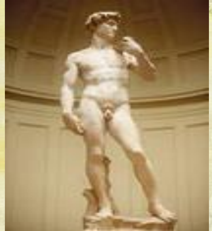
Статуя Давида Микельанджелло Б.