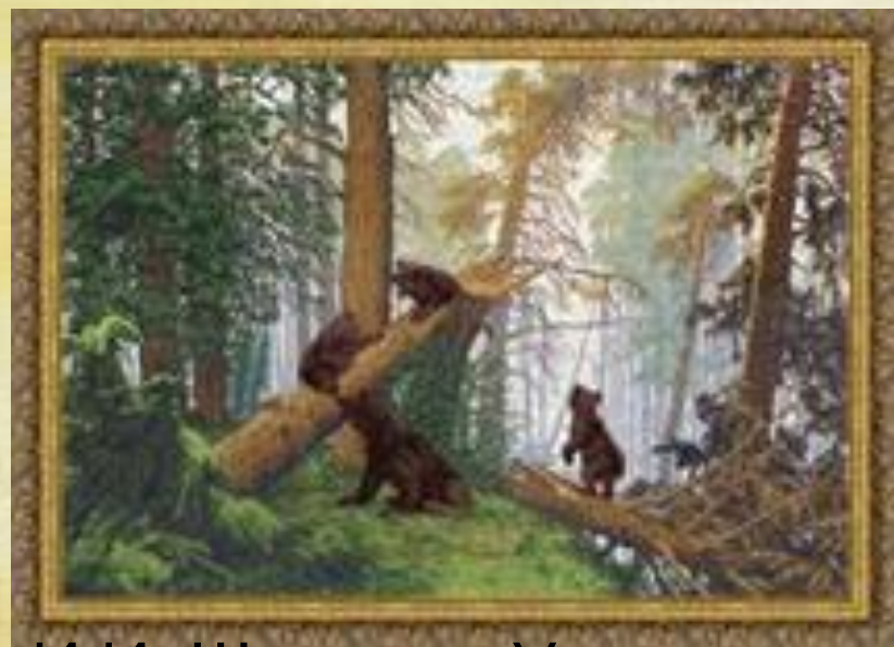
И.И. Шишкин «Утро в сосновом лесу»