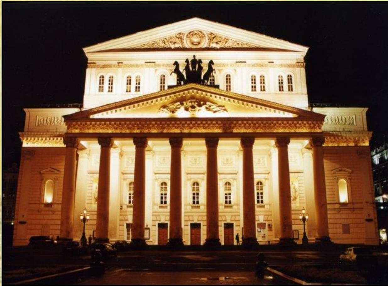
Здание Большого театра. (ГАБТ), Основан в 1776 в Москве

Театр — вид искусства, специфическим средством выражения которого является сценическое действие, возникающее в процессе игры актера перед публикой