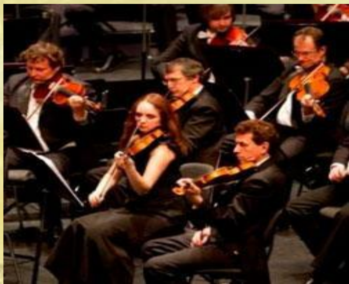
Государственный академический Большой симфонический оркестр им. П.И. Чайковского

МУЗЫКА (греческое musike , буквально - искусство муз), вид искусства, в котором средством воплощения художественных образов служат определенным образом организованные музыкальные звуки. Музыка фиксируется в нотной записи и реализуется в процессе исполнения.