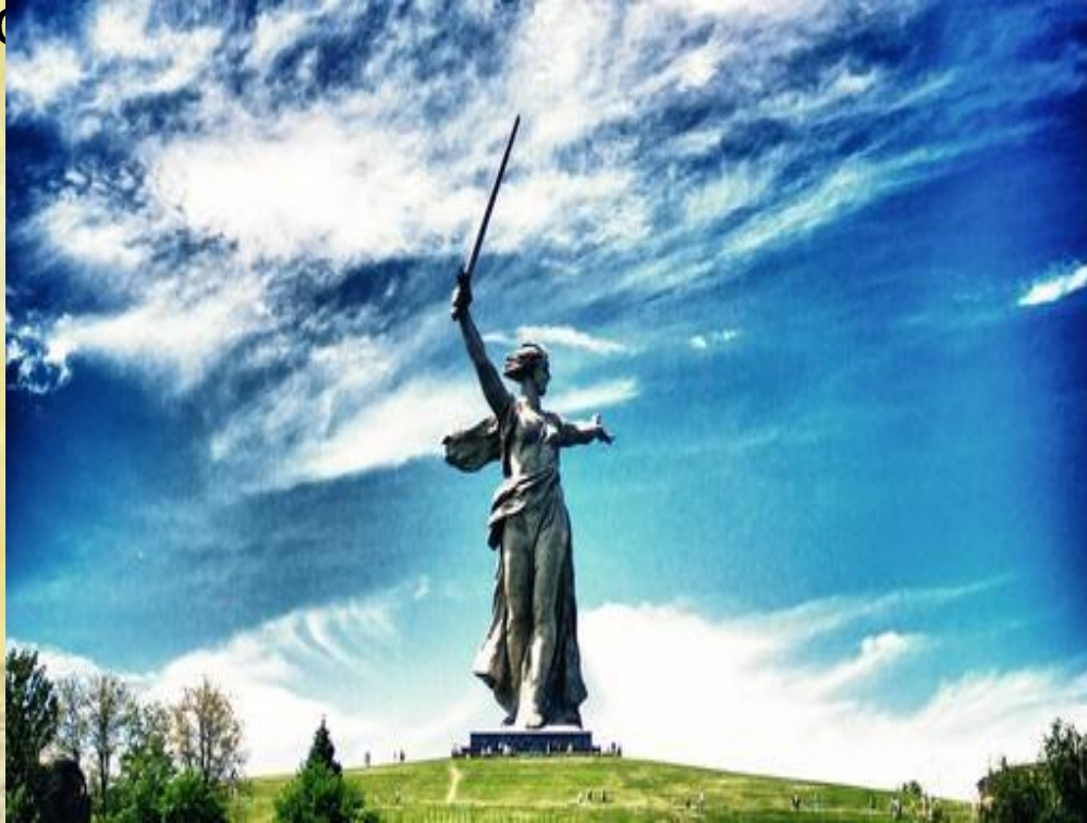
Статуя работы скульптора Вучетича Е.В. «Родина- Мать зовет»

Скульптура - вид изобразительного искусства — создание объемных изображений (статуй, бюстов, барельефов и т. п.) путем лепки, высекания, резания или