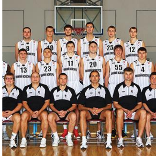
Субъекты физической культуры и спорта Нижегородской области