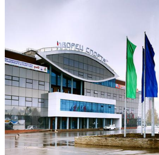
Представители объектов спорта Нижегородской области