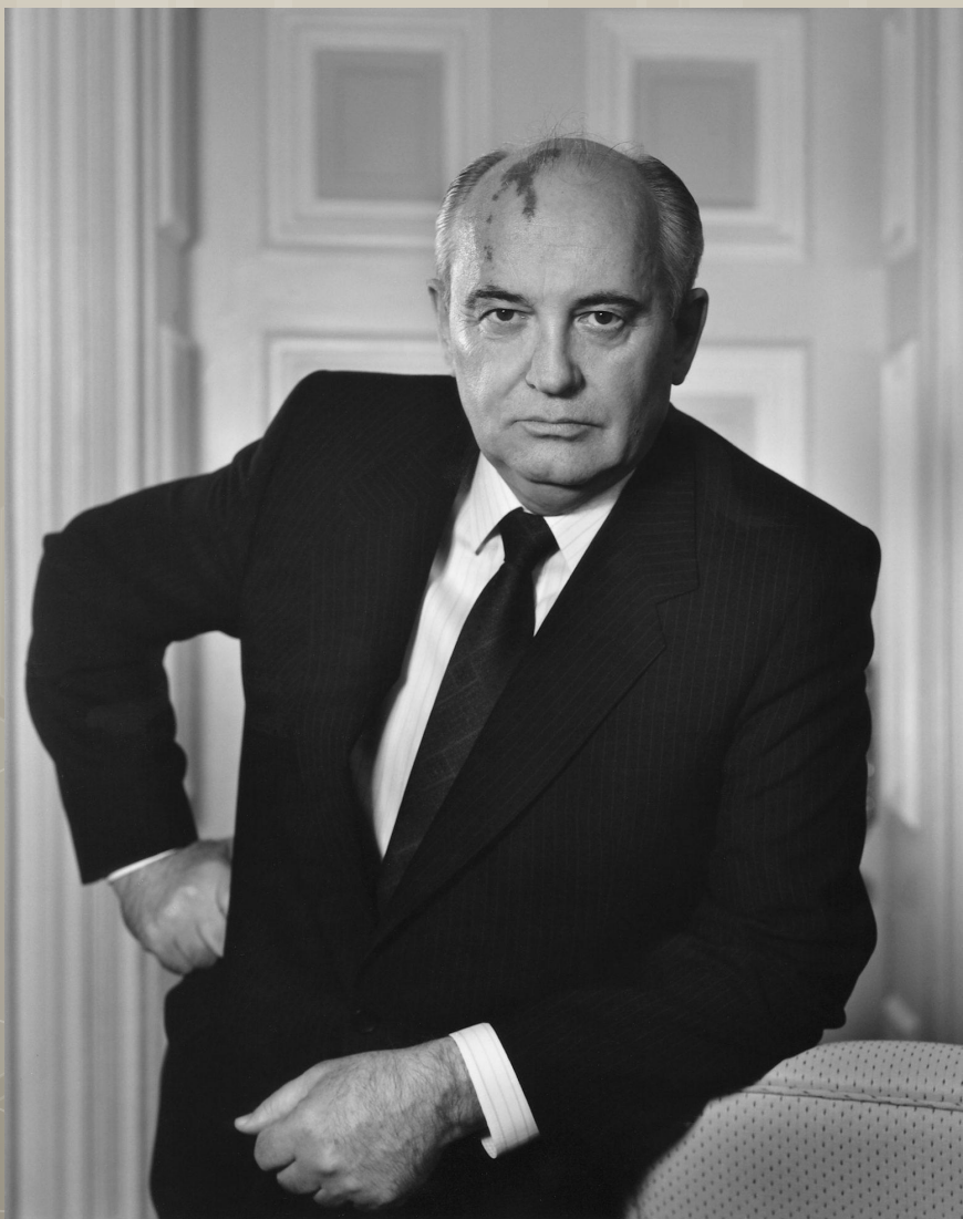
Михаил Сергеевич Горбачёв