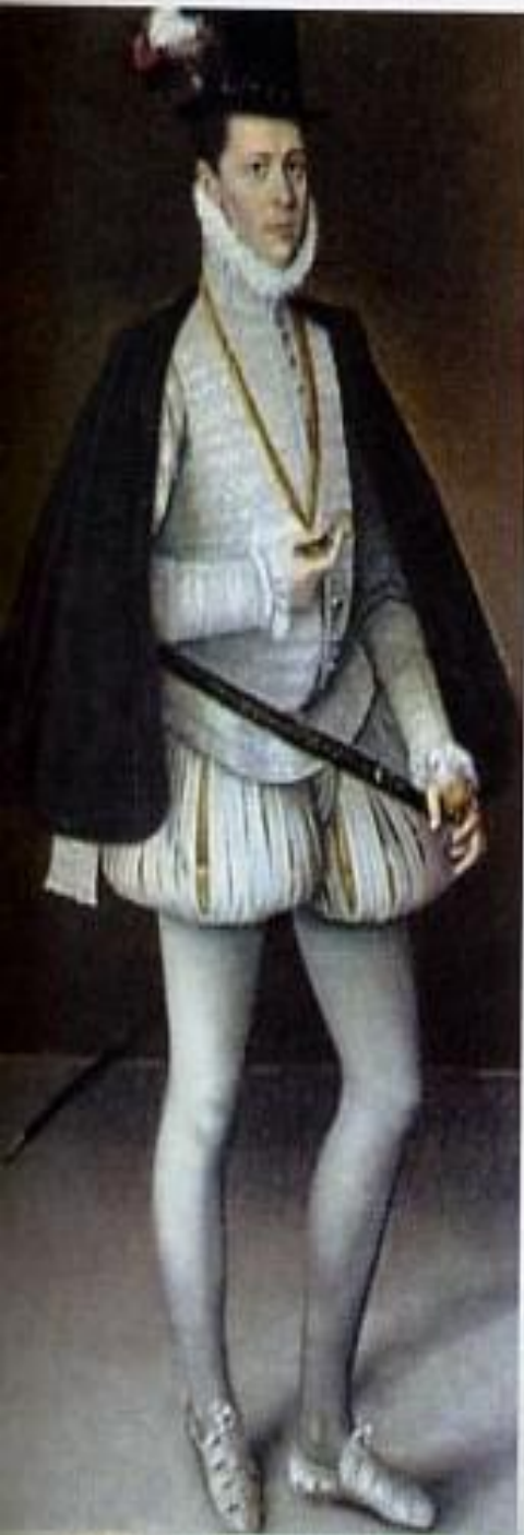
Хуан Пантоха де ла Крус. Дон Фернандо д'Арагон. 1581 г. Замок Нелагозевси. Богемия.

«Дольше, чем где бы то ни было в Западной Европе, сохранился на полуострове средневековый рыцарский уклад. Воинская доблесть, отчаянное удальство, беззаветное служение даме, корни которого надо искать в почитании Девы Марии, — вот добродетели, оставшиеся идеалом для Испании. С такими воинственными вкусами было связано тайное пренебрежение к учёности и разуму, а также невероятная гордость, прославленная по всему свету, пресловутая гордость: гордость национальная, присущая всем, гордость сословная, присущая каждому. Даже христианство утратило в Испании свойственные ему смирение и радость, оно приобрело исступлённый, мрачный, властный характер», — писал Лион Фейхтвангер.