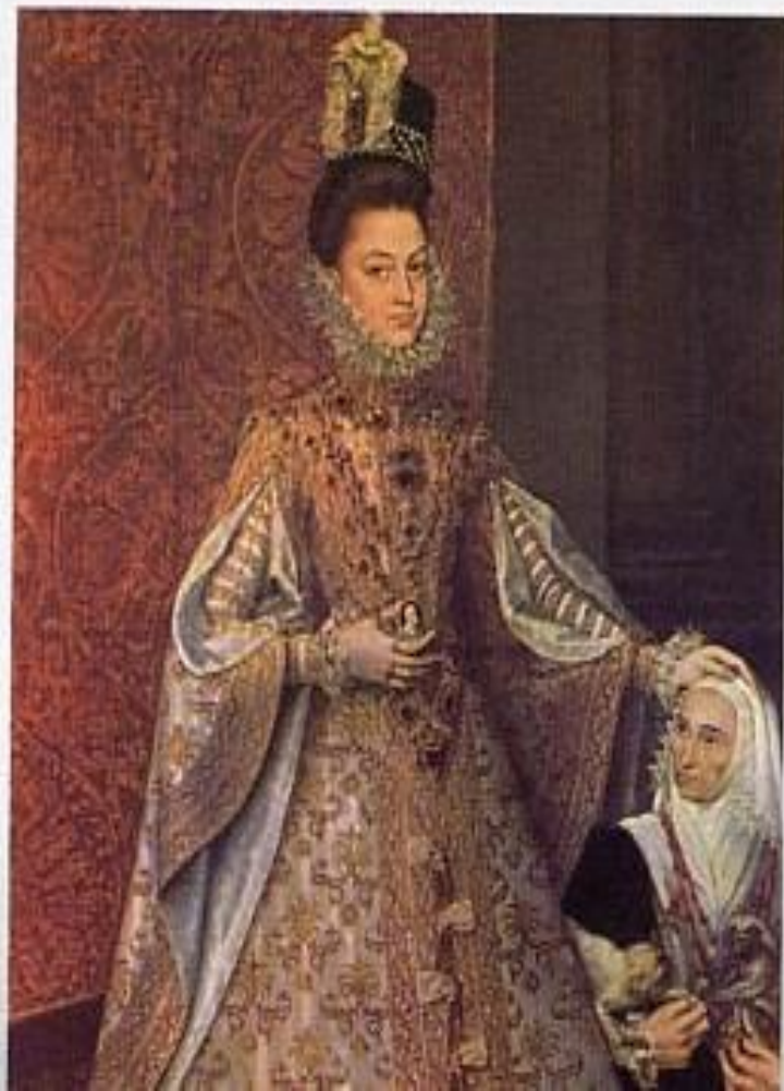
Диего дель Рианьо. Портрет Исабель Клары Эухении. 1584 г. Прадо. Мадрид.

«Дольше, чем где бы то ни было в Западной Европе, сохранился на полуострове средневековый рыцарский уклад. Воинская доблесть, отчаянное удальство, беззаветное служение даме, корни которого надо искать в почитании Девы Марии, — вот добродетели, оставшиеся идеалом для Испании. С такими воинственными вкусами было связано тайное пренебрежение к учёности и разуму, а также невероятная гордость, прославленная по всему свету, пресловутая гордость: гордость национальная, присущая всем, гордость сословная, присущая каждому. Даже христианство утратило в Испании свойственные ему смирение и радость, оно приобрело исступлённый, мрачный, властный характер», — писал Лион Фейхтвангер.