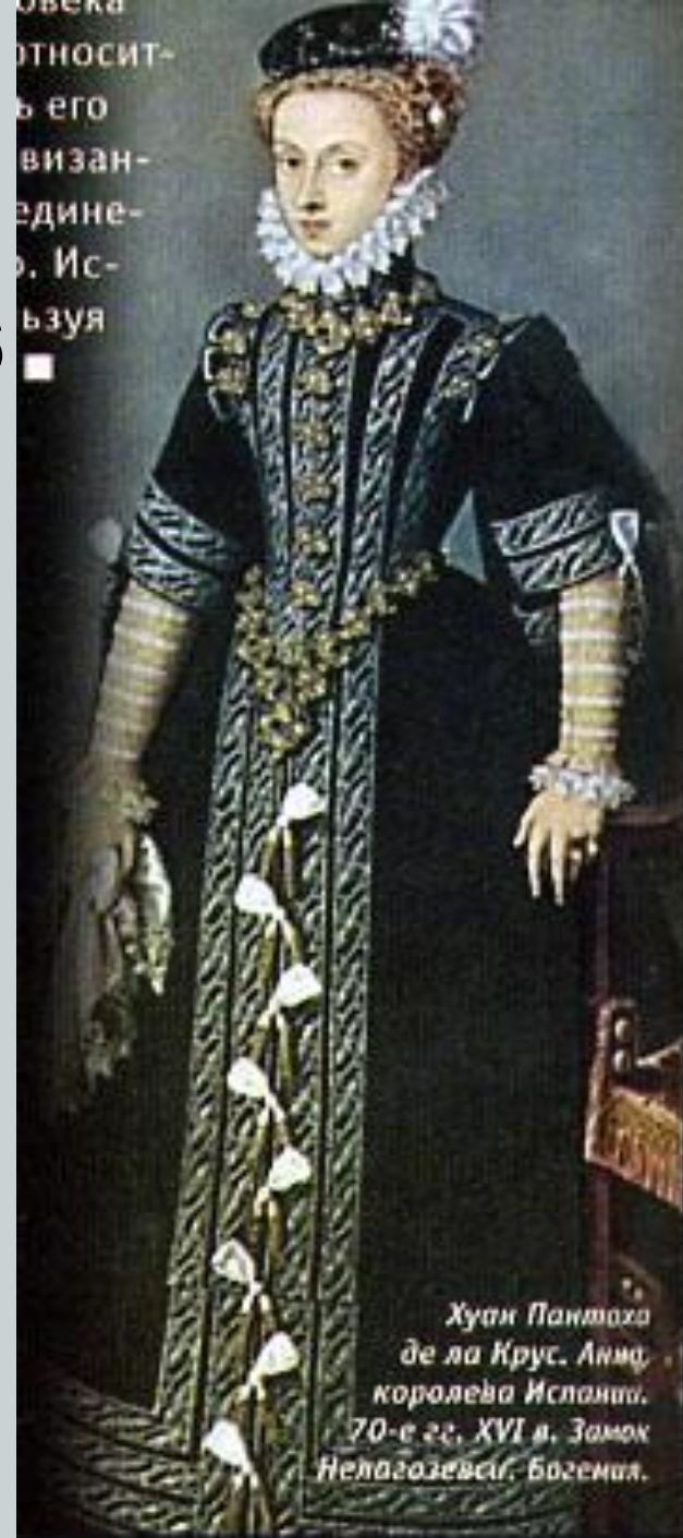
Хуан Пантаго де ла Крус. Анна, королева Испании. 70-е гг. XVI в. Замок Незагозевиц, Богемия.

В 1556г. Под власть Испании перешли Нидерланды..