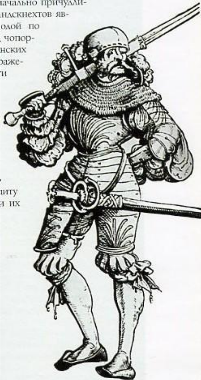
Ганс Бургмайер. Ландскнехт. Гравюра на меди.