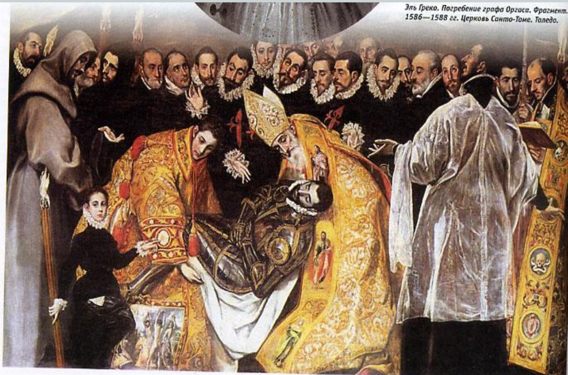
Эль Греко. Погребение графа Оргаса. Фрагмент. 1586—1588 гг. Церковь Санто-Томе, Толедо.