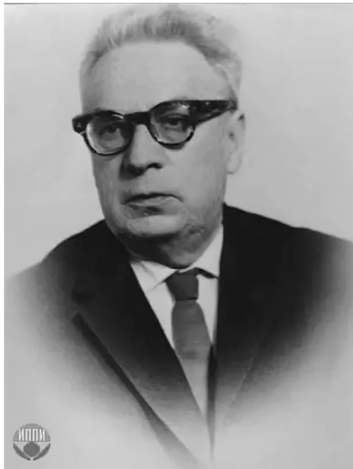
Андрей Андреевич Пионтковский