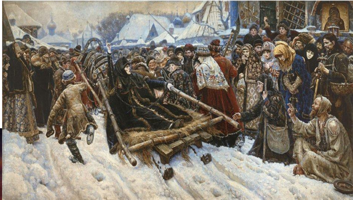
В. Суриков «Боярыня Морозова» (1883)