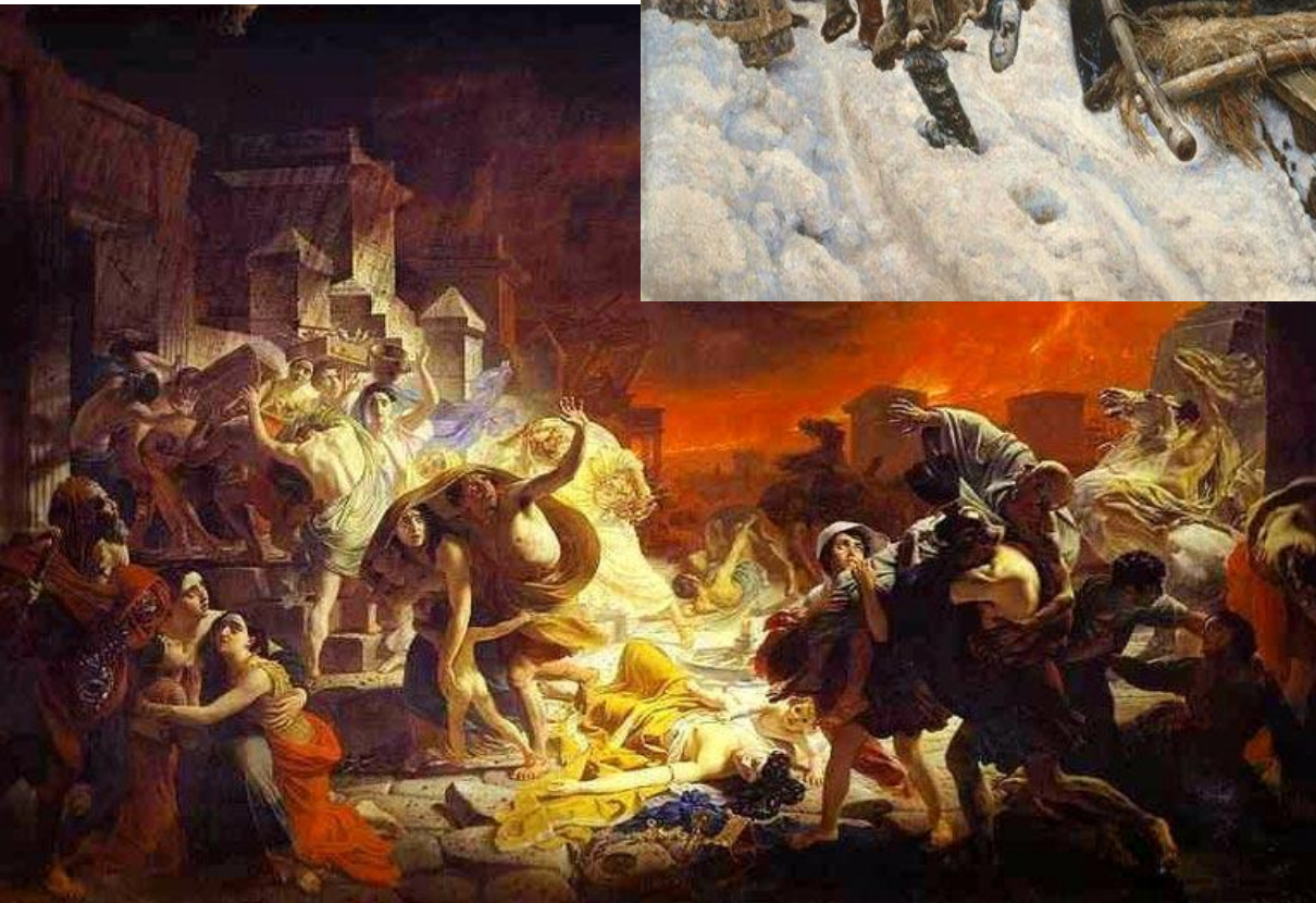
К. Брюллов «Последний день Помпеи» (1830)