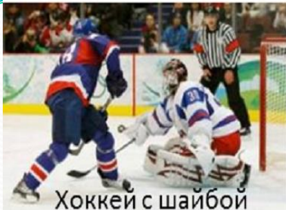
Хоккей с шайбой