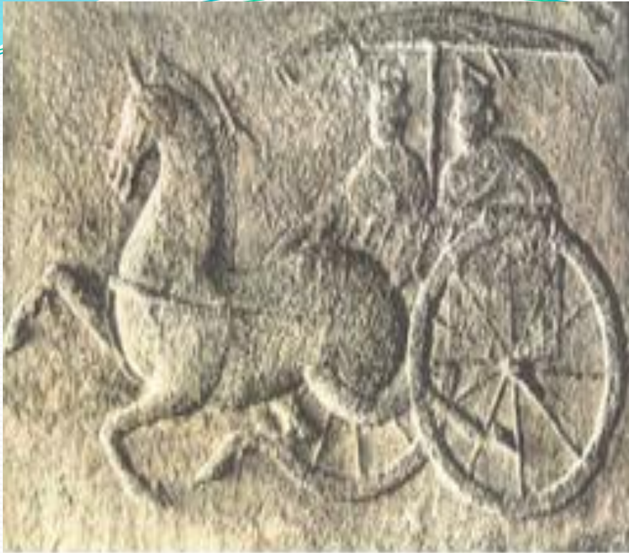
Гонки на колесницах. Древний Китай.