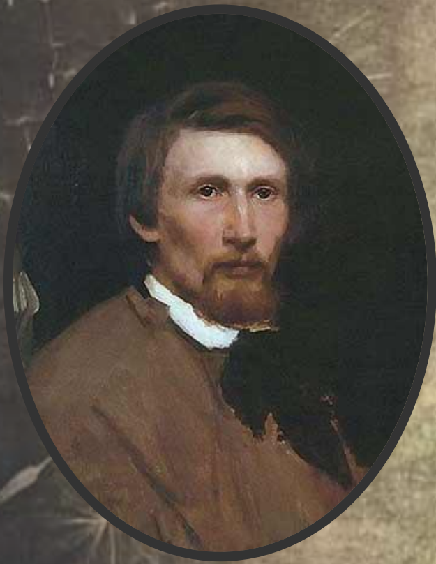
Васнецов Виктор Михайлович (1848-1926)