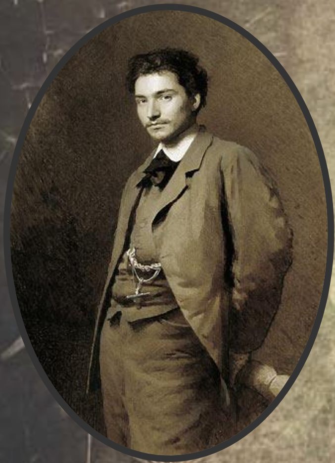
Федор Александрович Васильев (1850–1873)