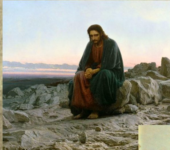
Христос в пустыне