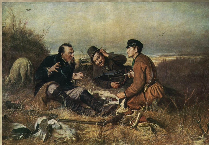
Охотники на привале