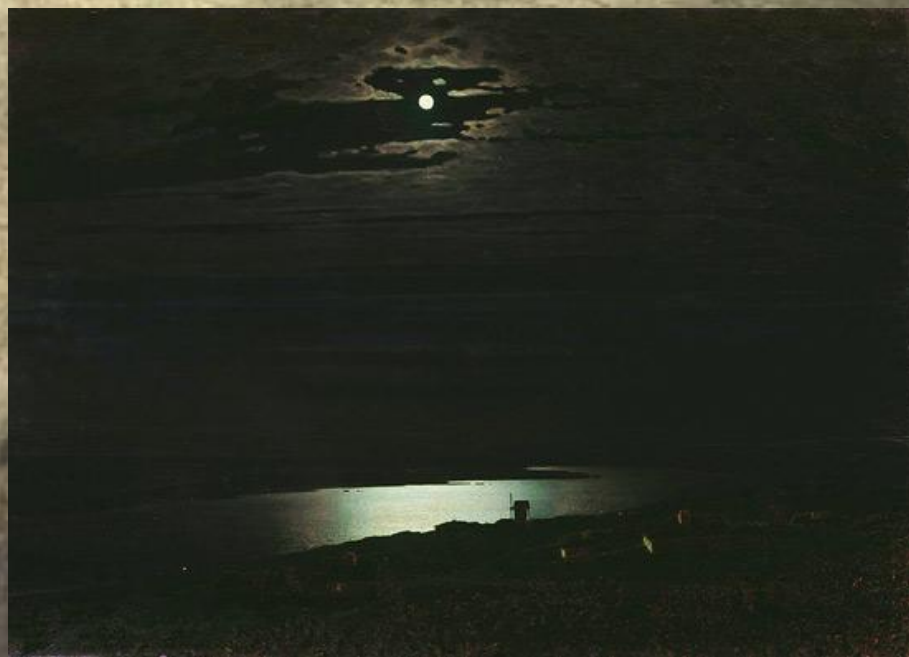
Лунная ночь на Днепре