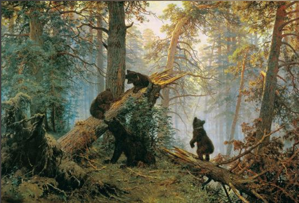
Утро в сосновом бору