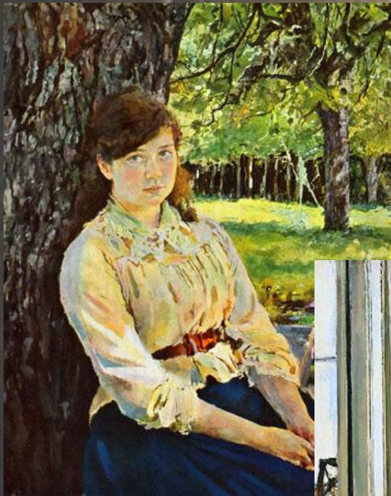
Девушка освещенная солнцем