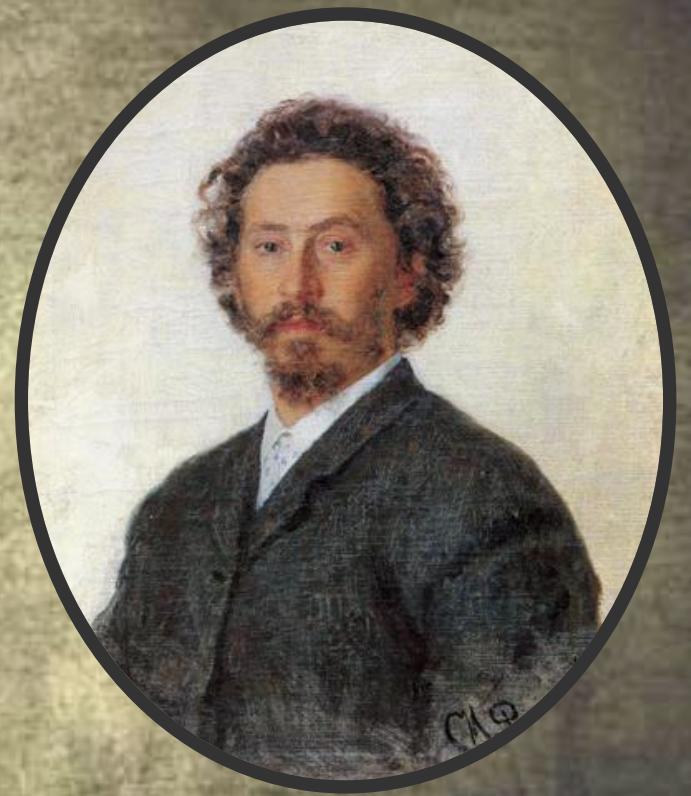
Илья Ефимович Репин (1844–1930)