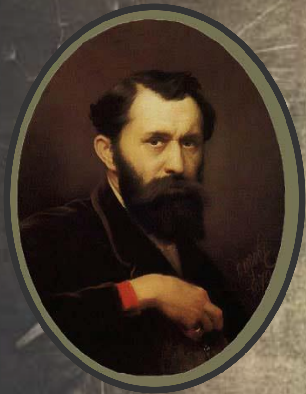
Василий Григорьевич Перов (1834–1882)