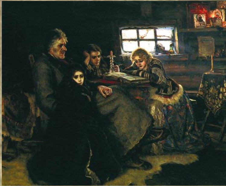
Меньшиков в Березове