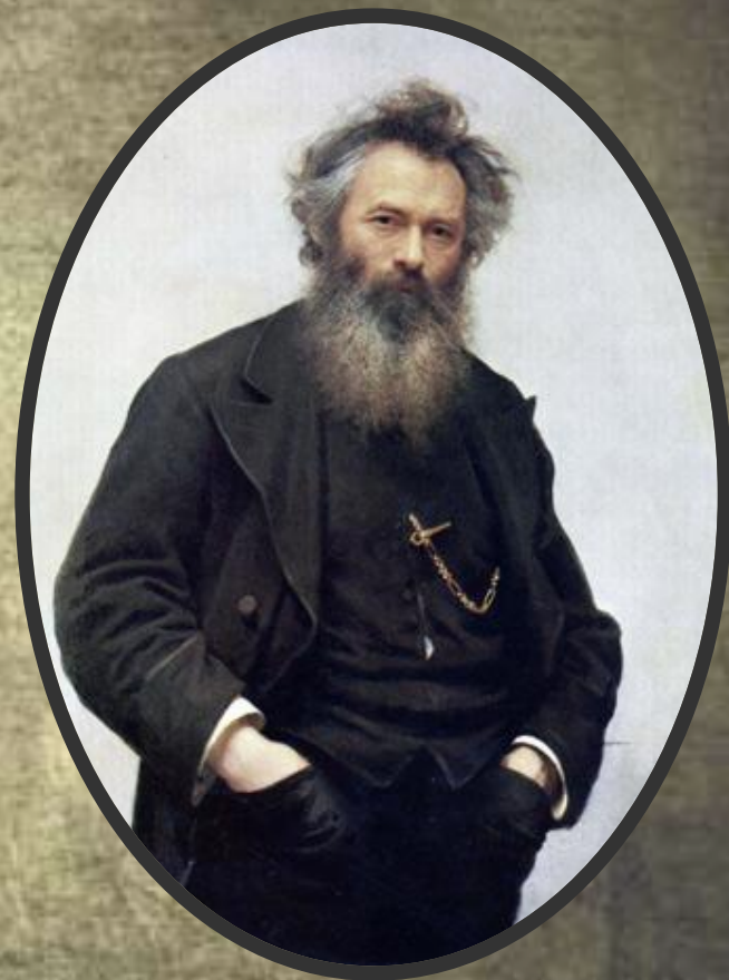
Иван Иванович Шмидт (1832–1898)