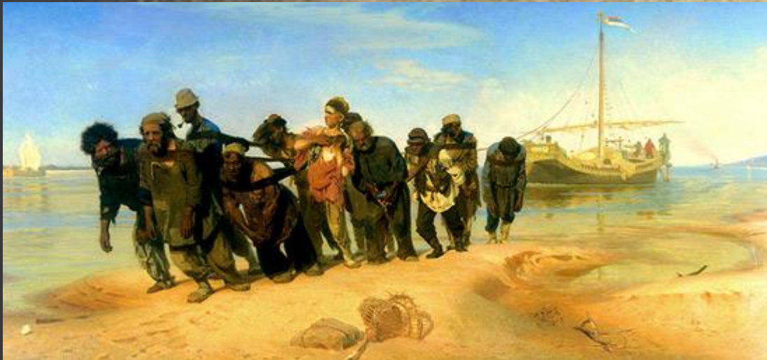
Бурлаки на Волге