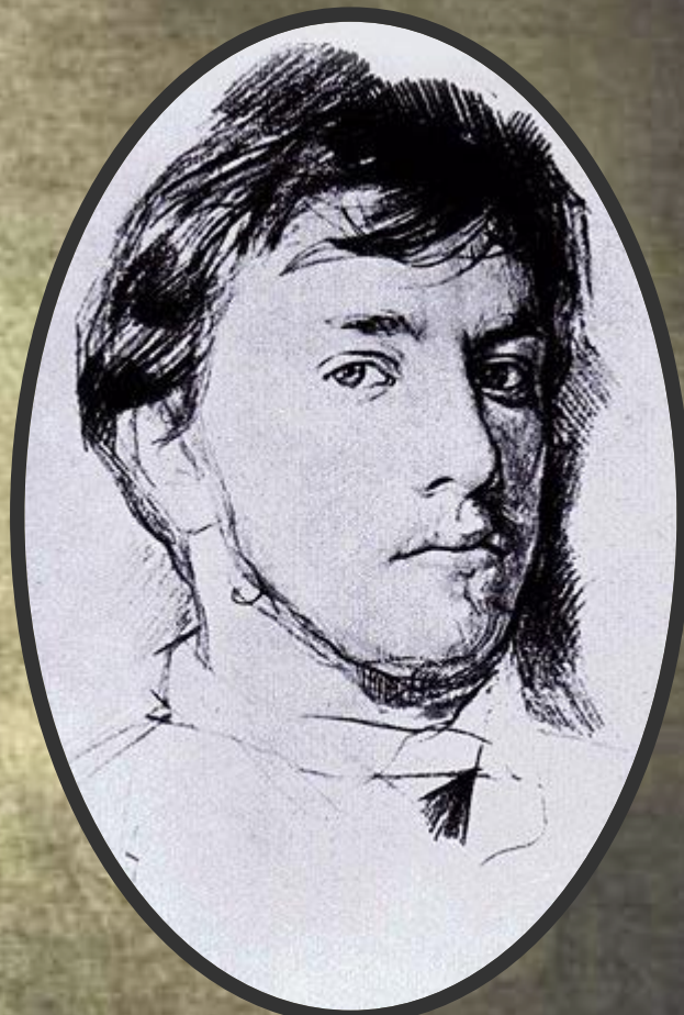
Серов Валентин Александрович (1865–1911)