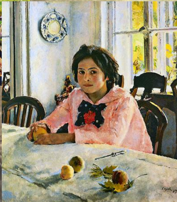
Девочка с персиками