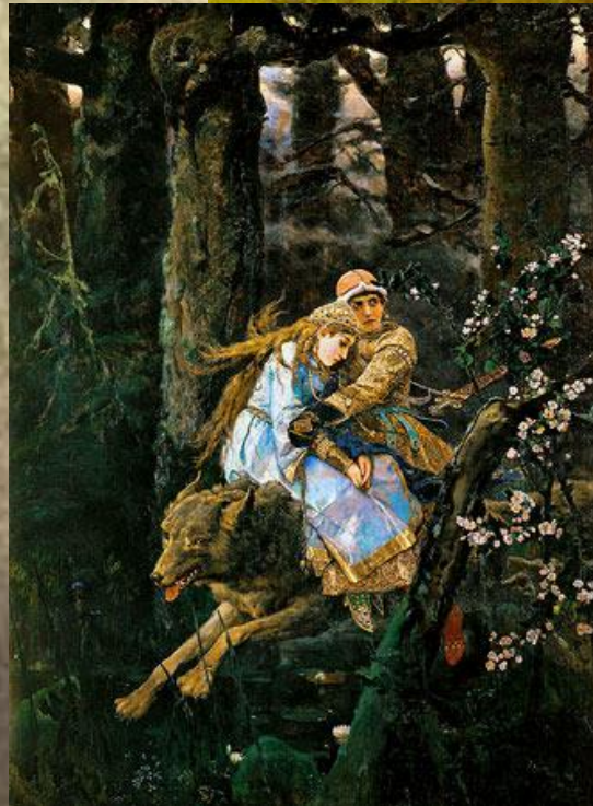
Иван царевич на сером волке