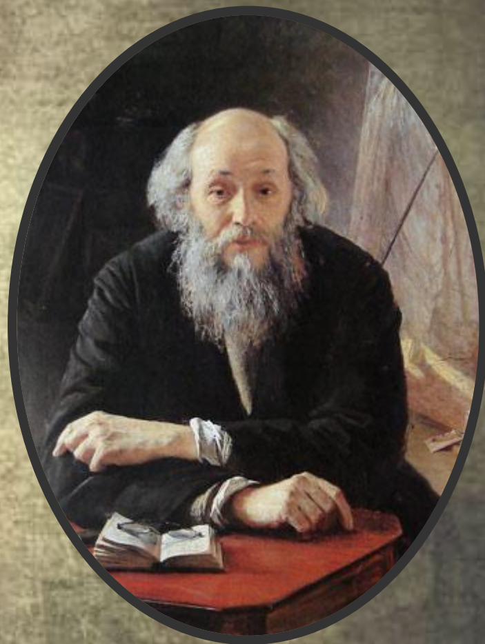
Ге Николай Николаевич (1831-1894)