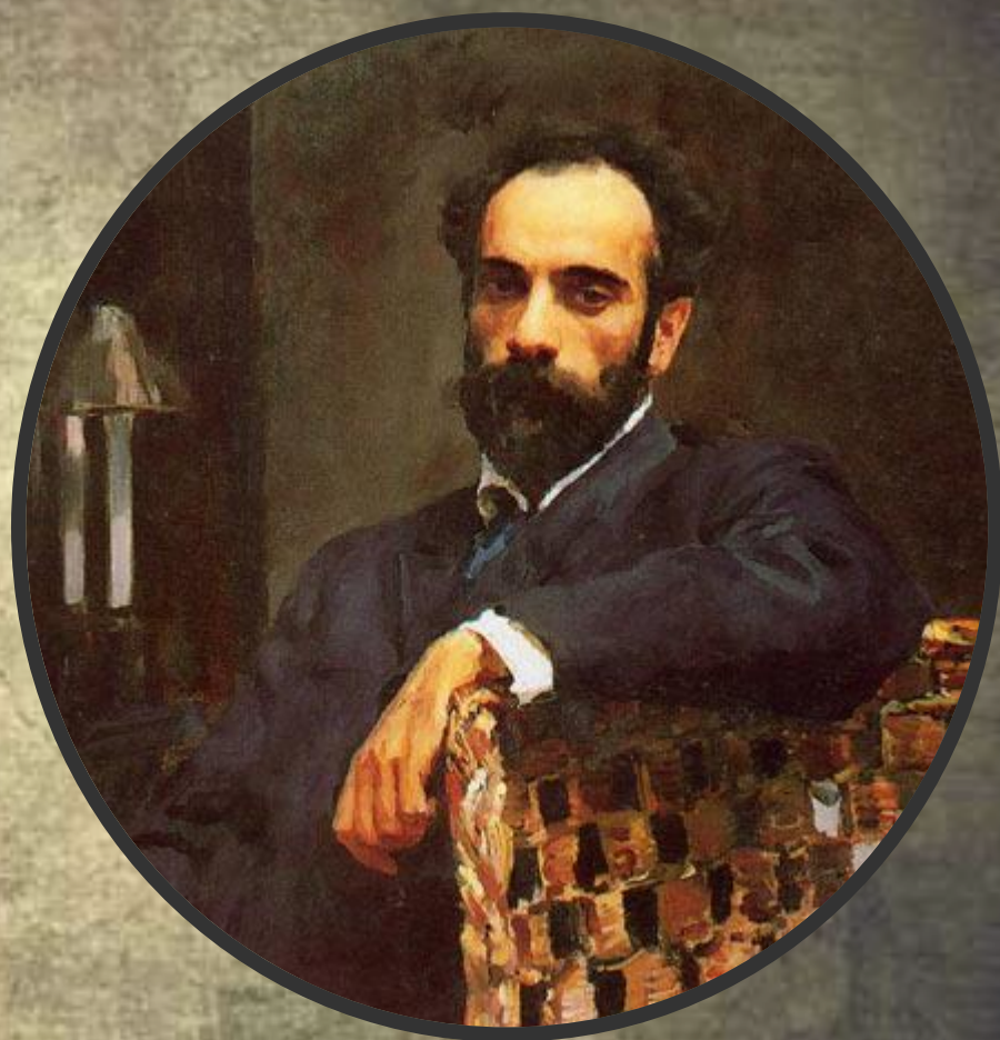
Исаак Ильич Левитан (1860–1900)