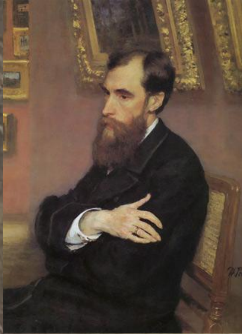
Портрет Павла Михайловича Третьякова