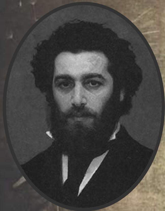
Архип Иванович Куинджи (1841–1910)