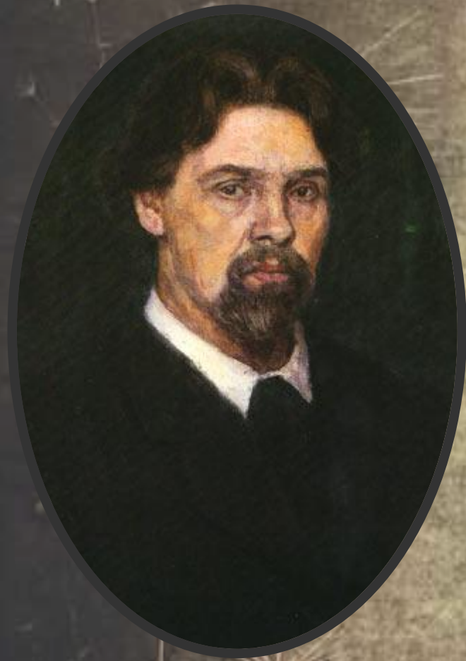
Василий Иванович Суриков (1848–1916)