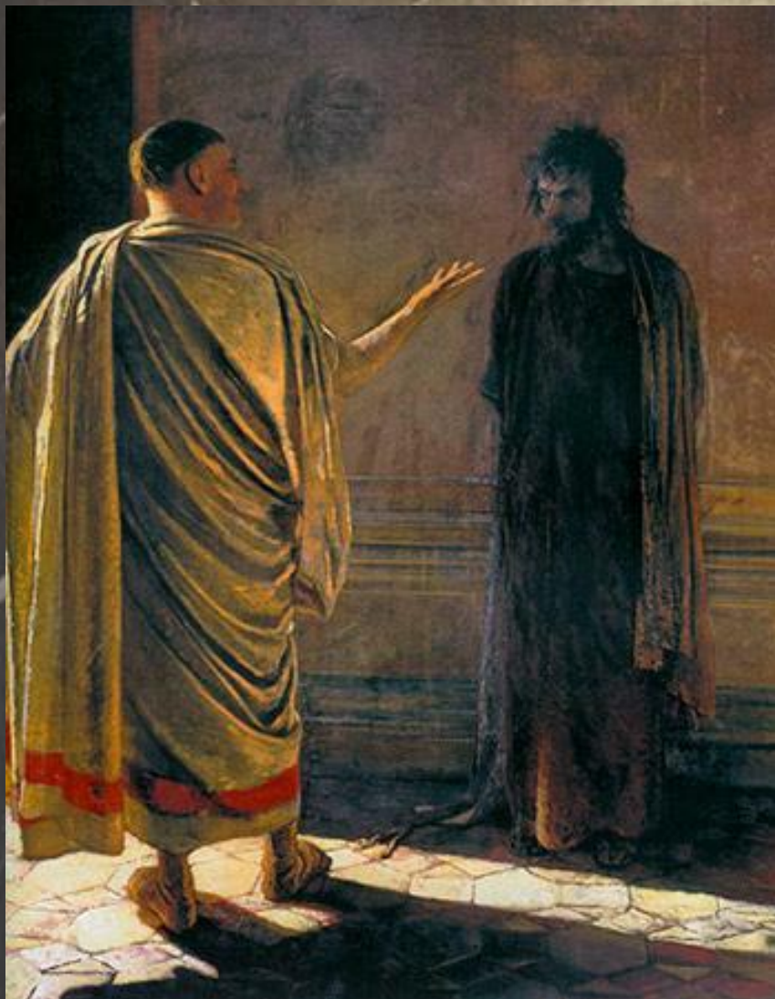
Что есть истина? - Христос и Пилат