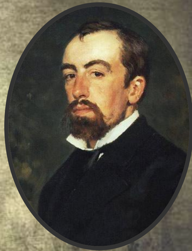
Василий Дмитриевич Поленов (1844-1927)