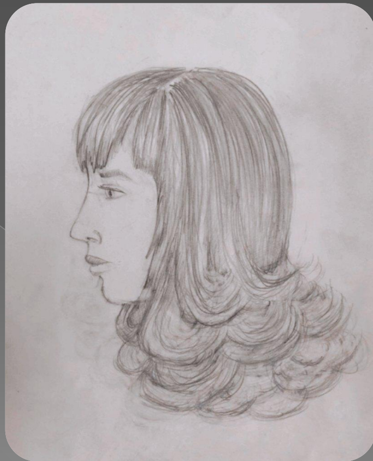
вид с боку