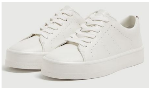
Pull and Bear