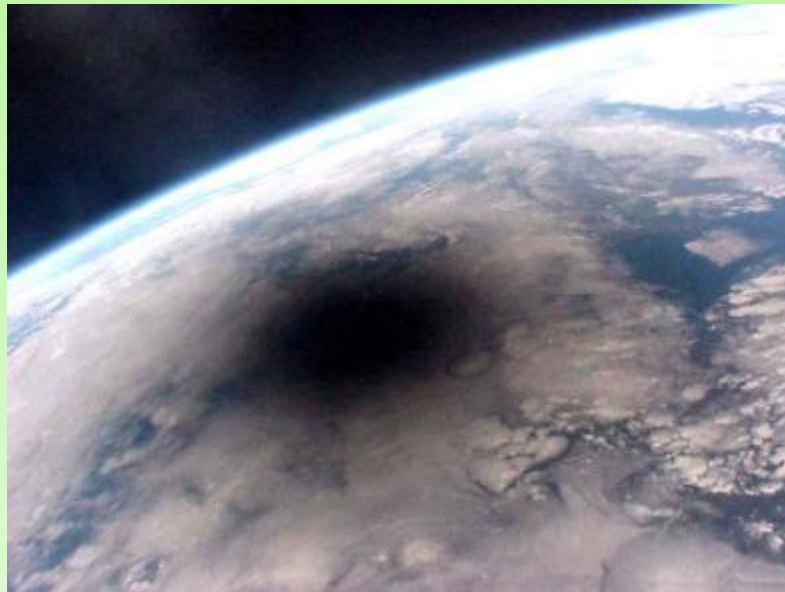
ОЗОНОВЫЕ ДЫРЫ И ВЫЖЖЕННАЯ ЗЕМЛЯ