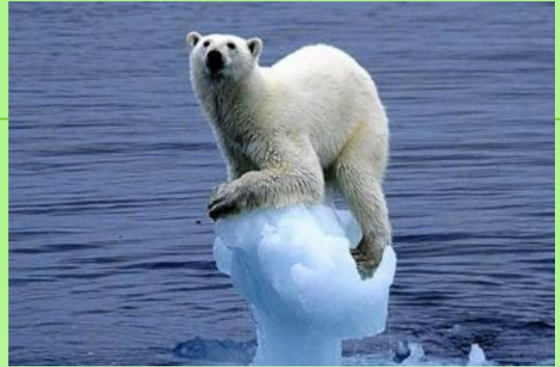
ПАРНИКОВЫЙ ЭФФЕКТ И ГЛОБАЛЬНОЕ ПОТЕПЛЕНИЕ