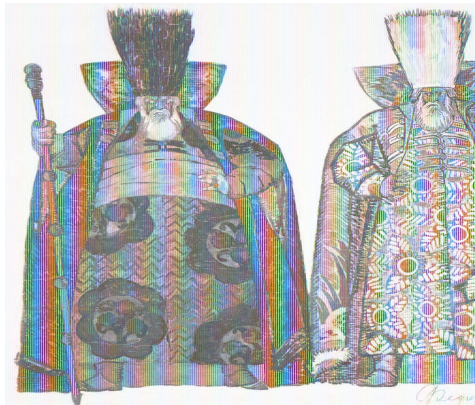
Эскиз 2 костюмов Ивана Хованского (Хованщина, 1913)