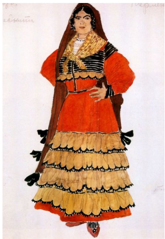
Эскиз костюма Кармен (Кармен, 1908)