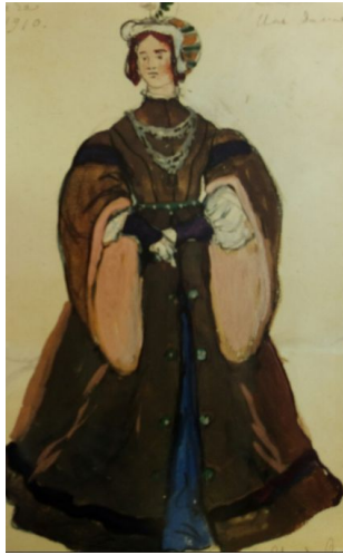
Эскиз костюма дамы (Жизель, 1909)