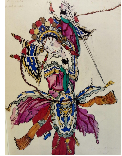
Эскиз костюма главной танцовщицы (Соловей, 1914)

Александр Бенуа — романтический рыцарь театральной декорации. Романтизирует историзм, вдохновляется утонченностью европейских исторических образов. Его работы не всегда ровные («несколько грузная гамма» по словам А.Левинсона), но выполнены с большой любовью и вниманием, особенно эскизы костюмов.