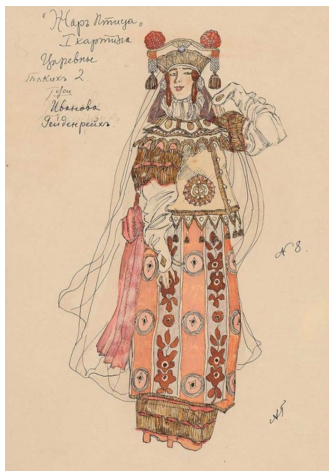
Эскиз костюма пленённой царевны (Жар-Птица, 1910)