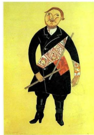
Эскиз костюма купца (Шут, 1921)