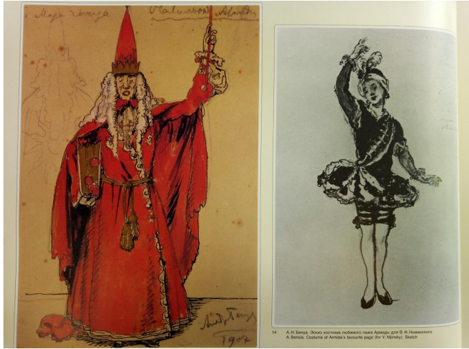
Эскизы костюмов Красного Мага и Пажа (Павильон Армиды, 1909)