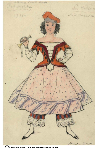
Эскиз костюма танцовщицы (Петрушка, 1911)