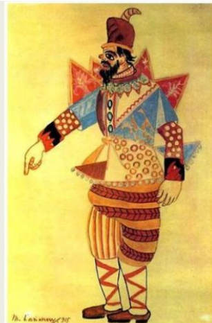
Эскиз костюма мужчины (Шут, 1921)

Воплощает синтез искусств в авангарде: в дягилевской антрепризе занимался костюмами, сценографией, активно помогал создавать образы, работал как консультант с хореографией. В сценографии и эскизах костюмов использовал найденные им методы «лучизма» («Полуночное солнце», «Лисица»). По сравнению с Гончаровой, более склонен к мелким, дробящимся формам, геометризации.