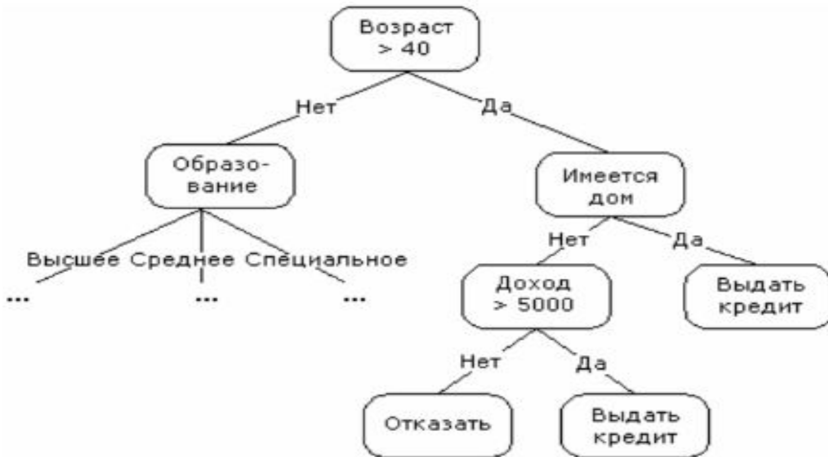
Р и с.2. Дерево решений

На рис.2 показан пример использования дерева решений по принятию решения о выдаче кредита.