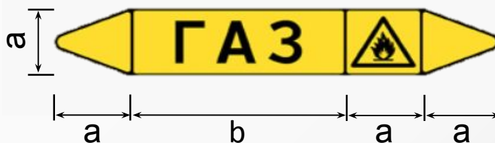
Маркер указания места отбора вещества P.6