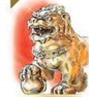
Дванадцать каменных львов и два тигра охраняют дацан.

По своим пропорциям и композиционному строению является продолжением традиций буддийского строительного искусства, с несильно упрощенным архитектурным декором.