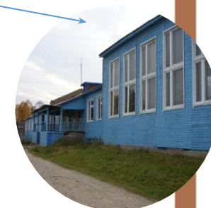
МОУ «Глотовская СОШ»