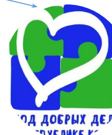
МОУ «Косланская СОШ»