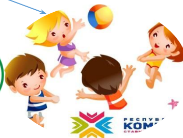
МУДО «Удорская ДЮСШ»