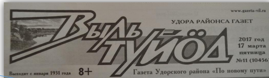
Районная газета «Выль туйёд» («По новому пути»)