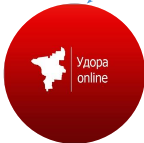
Информационный портал Удорского района «Удора online»