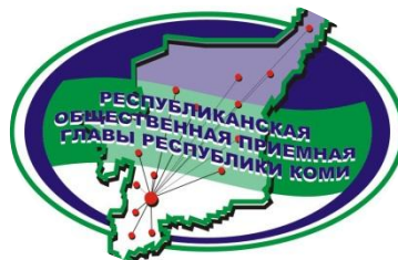
Удорский филиал Общественной приемной Главы РК