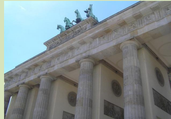
das Brandenburger Tor