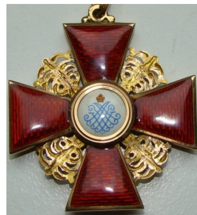
Орден Св. Анны 2-й степени