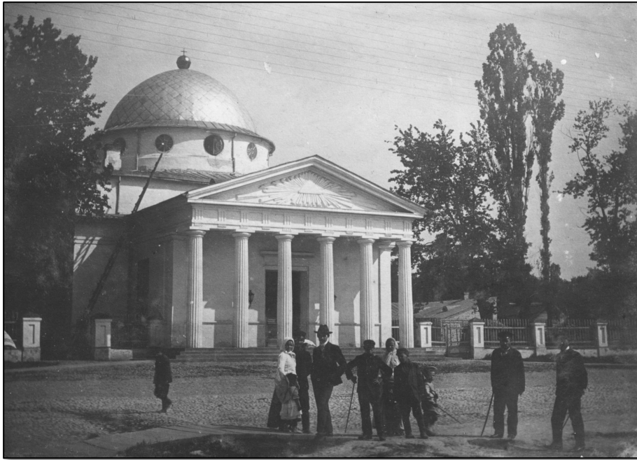
Могилёвский Иосифовский Кафедральный собор (уничтожен в 1938 году)