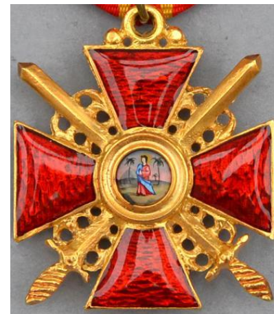
Орден Св. Анны с мечами 3-й степени