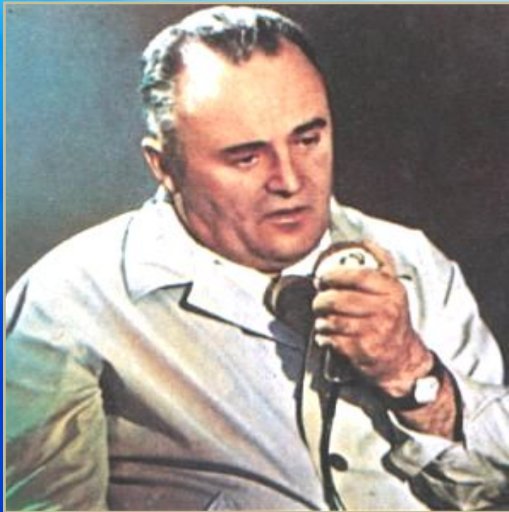
Сергей Павлович Королёв

Учёный, конструктор и организатор производства ракетно-космической техники и ракетного оружия СССР, основатель практической космонавтики.