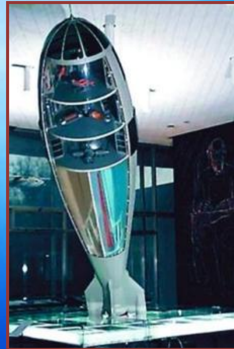
Макет ракеты К.Э. Циолковского