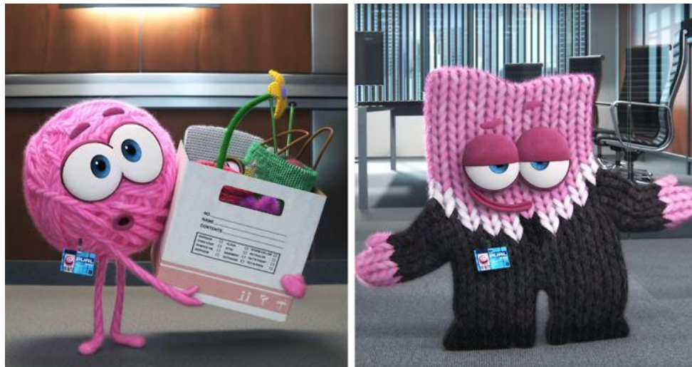
“Purl” by Pixar

По моему мнению, неоднозначность данной идеи заключается в том, что большая часть людей относится к неизвестному с презрением и опаской. И чтобы добиться признания, стоять на месте и бездействовать не получится, потому что от каждого человека общество требует постоянного участия в повседневной жизни. И это становится ещё сложнее, когда ты отличаешься от окружающих. Трудно завоевать доверие, когда ты больше других в несколько раз и одним махом можешь бесплатно снести парочку этажей высотки.