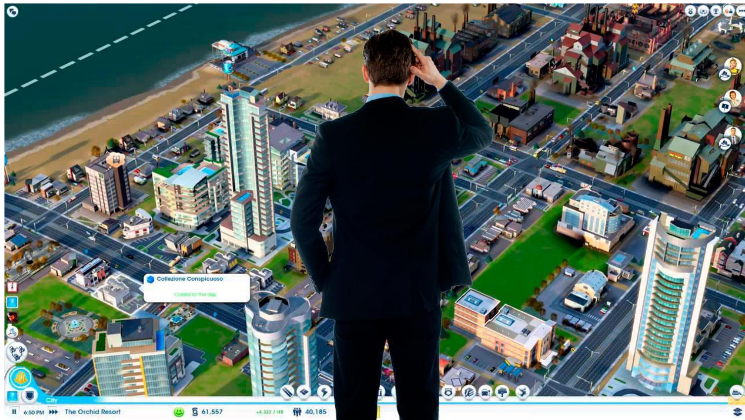
Интерфейс как в SimCity