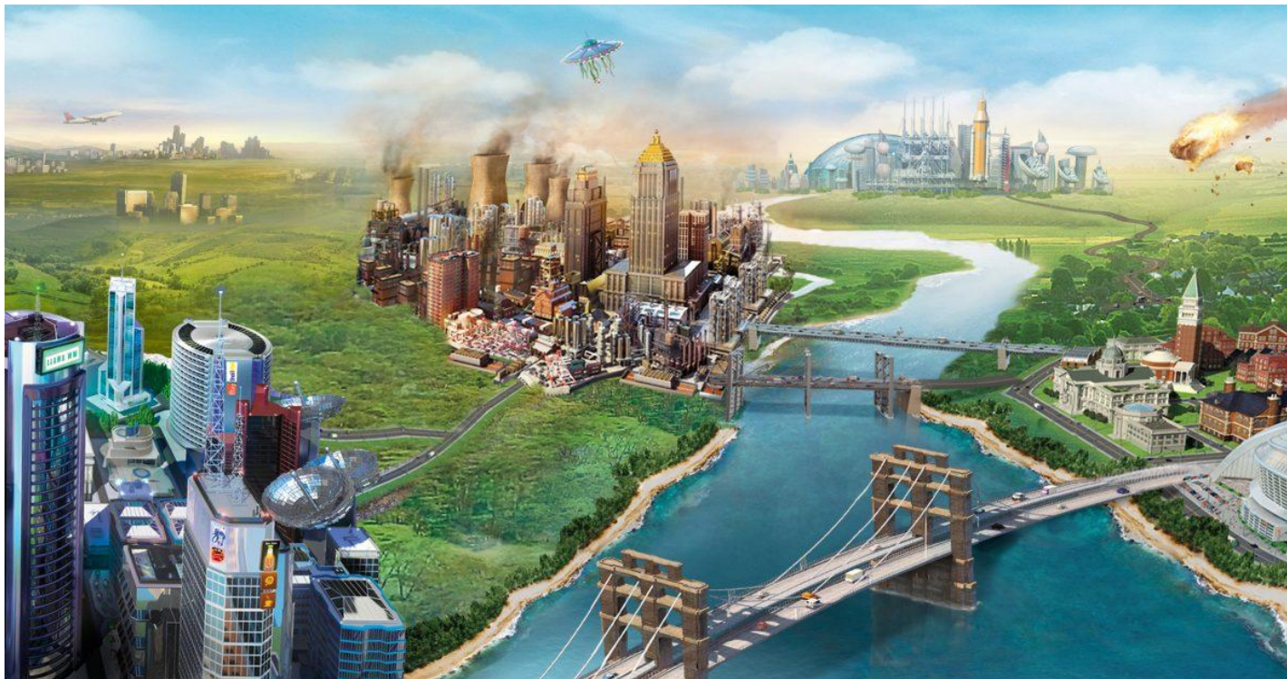
“SimCity” by Electronic Arts

Жанр игры: симулятор управления городом. Вид от третьего лица. Рассчитано на одного человека.