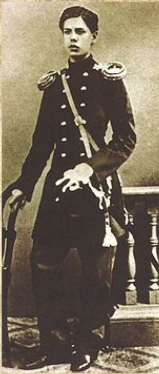
Юный Модест Петрович в форме гвардейского офицера