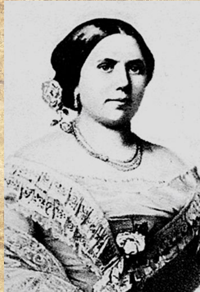
Дарья Михайловна Леонова (1829-1896) русская оперная и камерная певица (контральто)