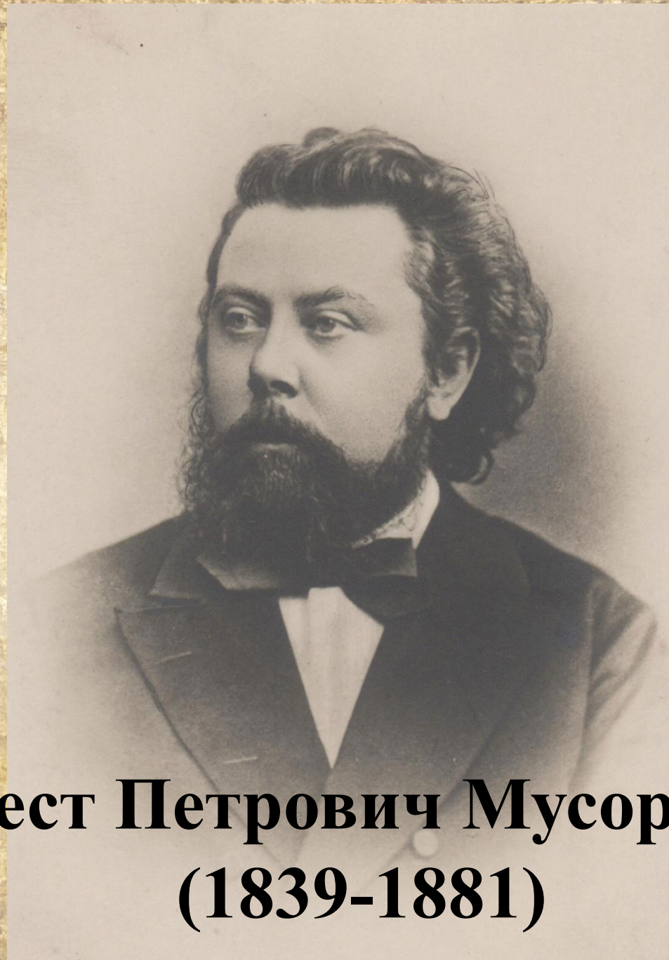
Модест Петрович Мусоргский (1839-1881)