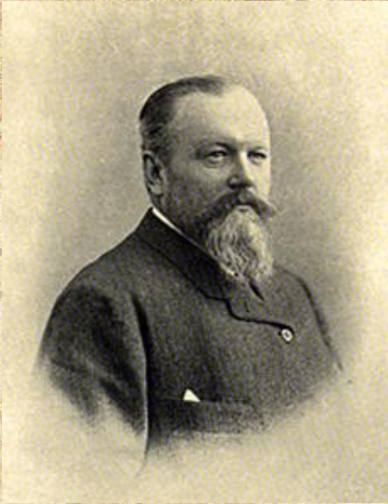
Арсений Аркадьевич Голенищев-Кутузов (1848-1913) русский поэт, прозаик, критик