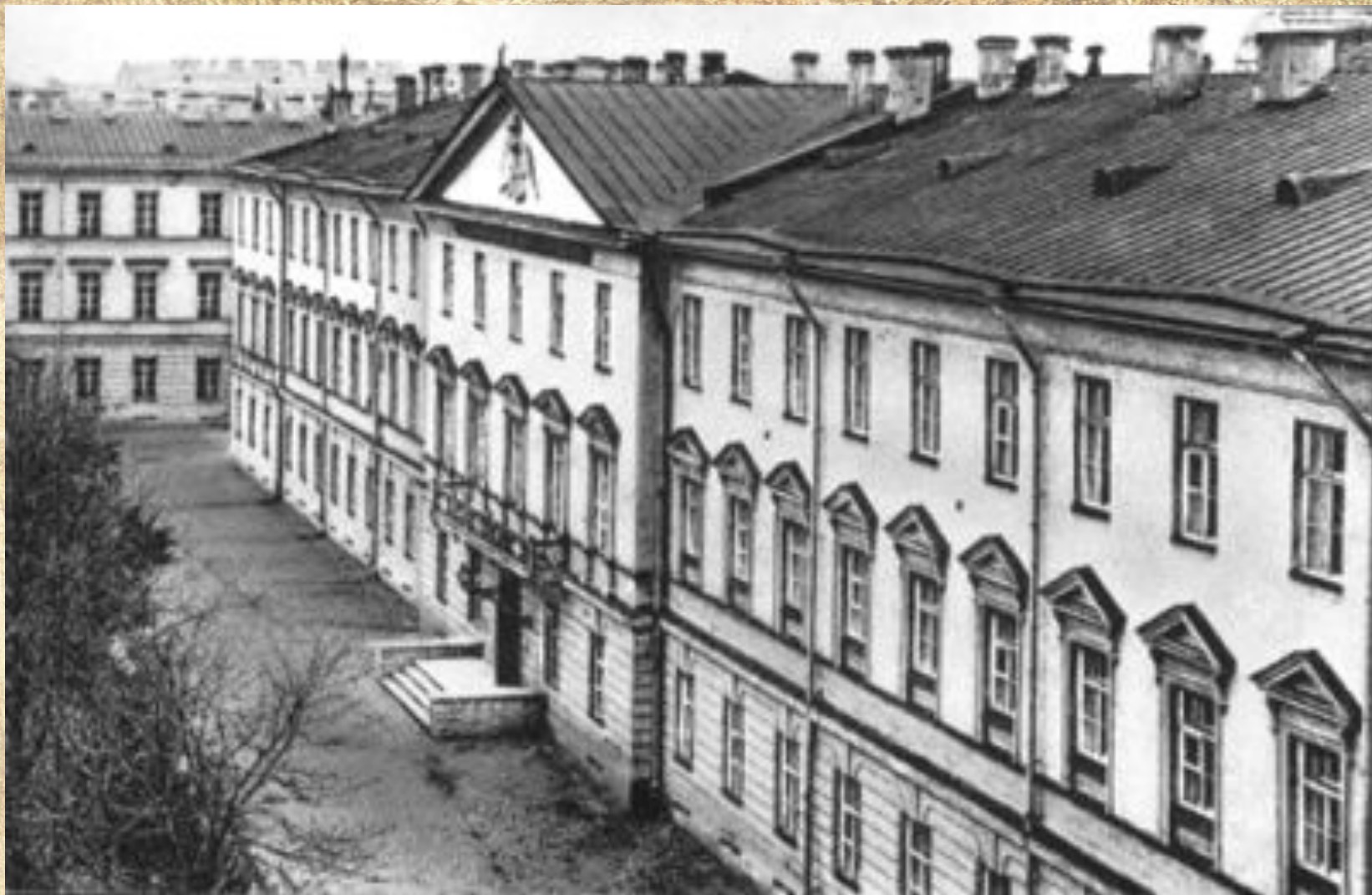
Школа гвардейских подпрапорщиков и кавалерийских юнкеров