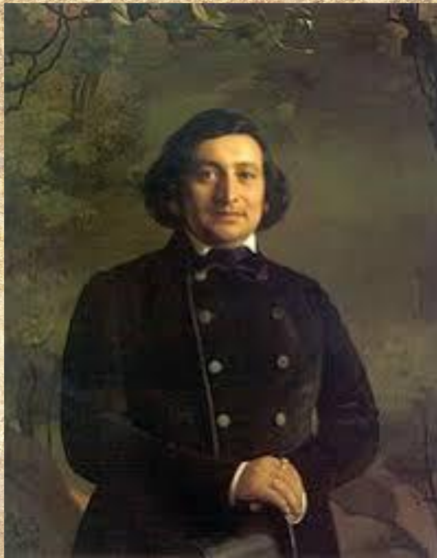
Осип Афанасьевич Петров (1806-1878) Русский оперный певец (бас)