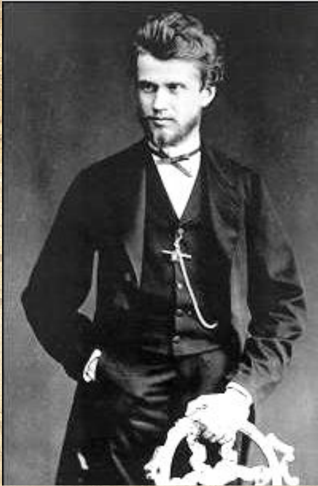
Эдуард Францевич Направник (1839-1916) русский композитор, дирижер