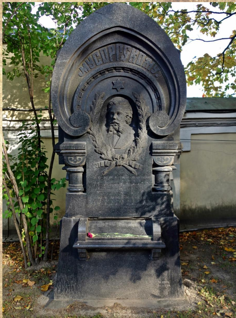
Могила М.П. Мусоргского в Некрополе Санкт-Петербурга

16 марта 1881 года после продолжительной тяжелой болезни скончался М.П. Мусоргский