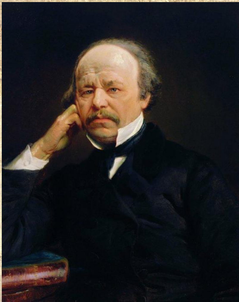
Александр Сергеевич Даргомыжский (1813-1869) русский композитор