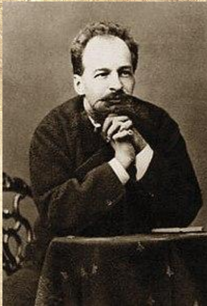
Виктор Александрович Гартман (1834-1873)

русский архитектор, орнаментист и художник