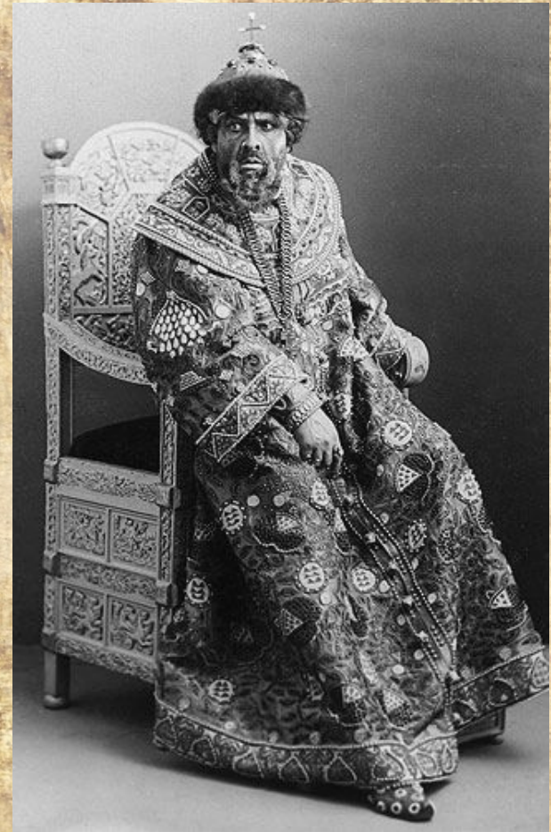
Федор Иванович Шаляпин в костюме царя Бориса Годунова