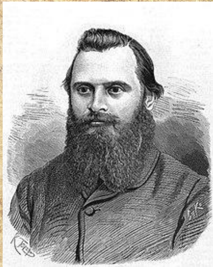
Милий Алексеевич Балакирев (1837-1910) Русский композитор, педагог, руководитель «Могучей кучки»