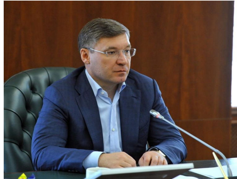
Руководитель: Владимир Якушев , министр строительства и жилищно- коммунального хозяйства РФ