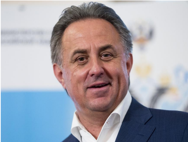
Куратор: Виталий Мутко , заместитель председателя Правительства РФ