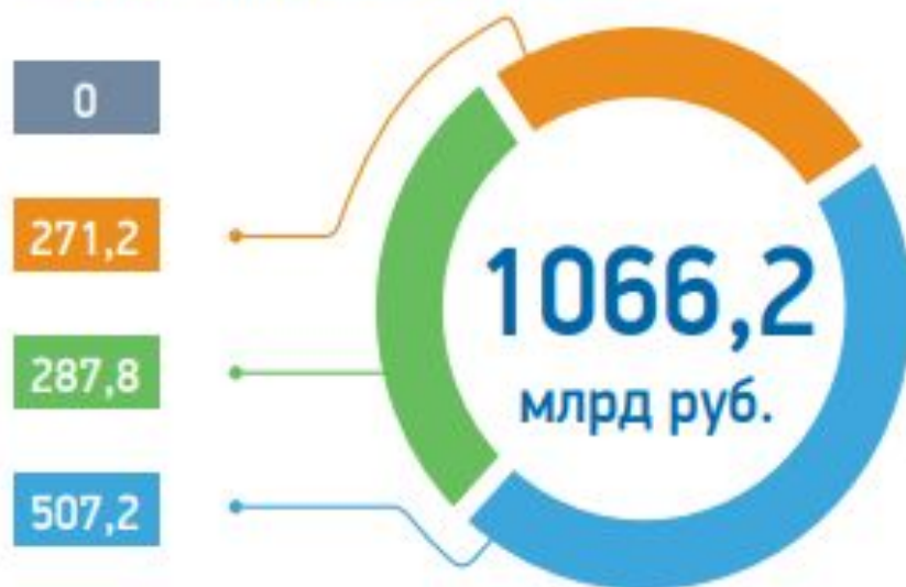
Бюджет национального проекта