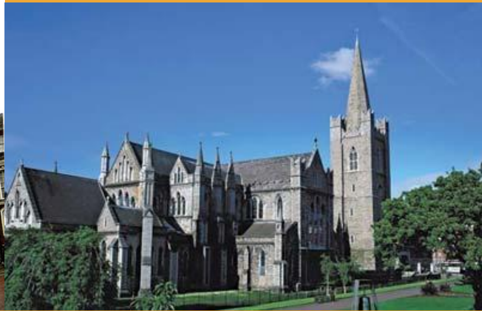
Собор святого Патрика