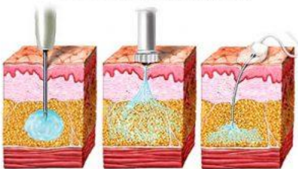
Шприц или ручка-шприц