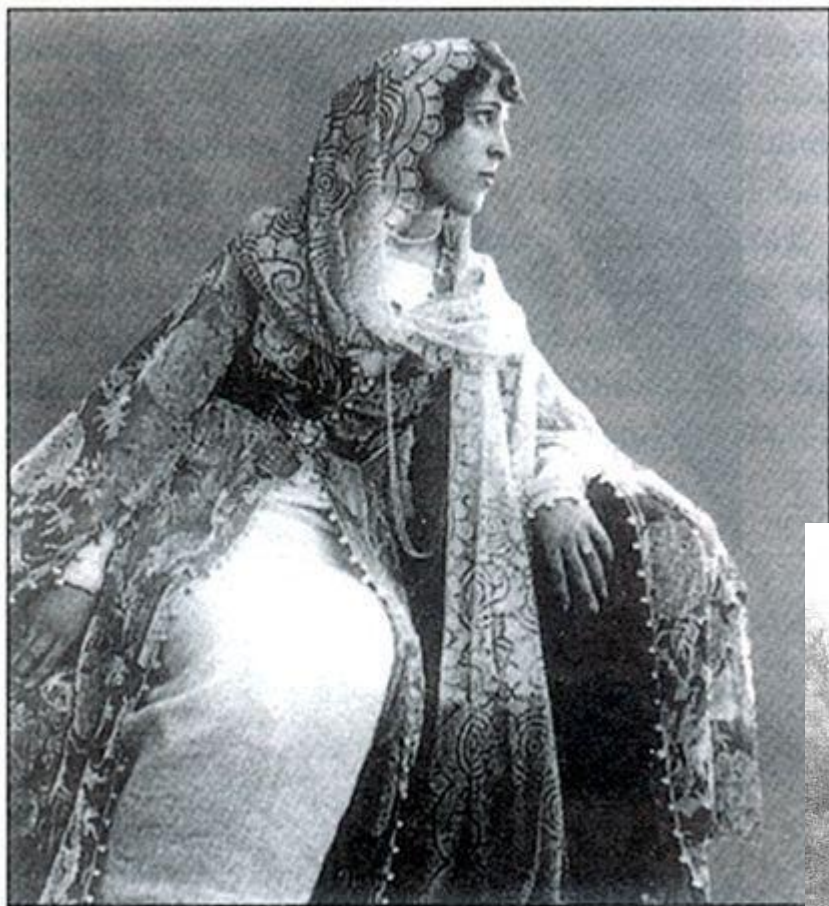
Чеченка. Начало XX в.

Новые веяния не обошли стороной и одежду, которую носили чеченцы. Во-первых, изменился покрой традиционной одежды, как мужской, так и женской. Кроме того, традиционное «горское» сукно все больше вытеснялось фабричными тканями. И, наконец, в обиходе появился европейский костюм.