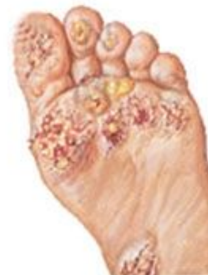
Кератодермия и пустулезные изменения на подошвах