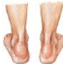
Ахиллобурсит, эритема, припухлость, болезненность