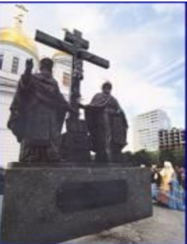
Памятник Кириллу и Мефодию в Самаре

В Моравии Кирилл и Мефодий продолжали переводить церковные книги с греческого на славянский язык, обучали славян чтению, письму и ведению богослужения на славянском языке.