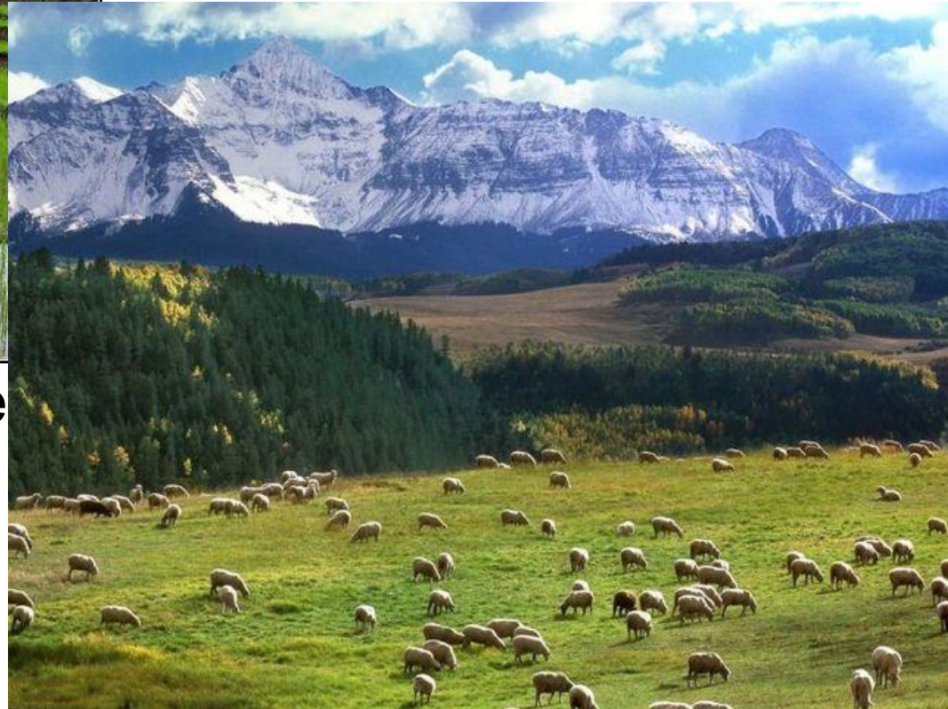
Пастбище в горном районе Алатау