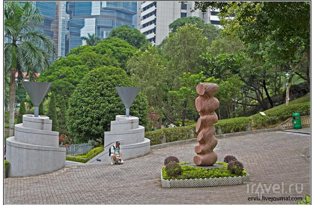
Городской парк Гонконга