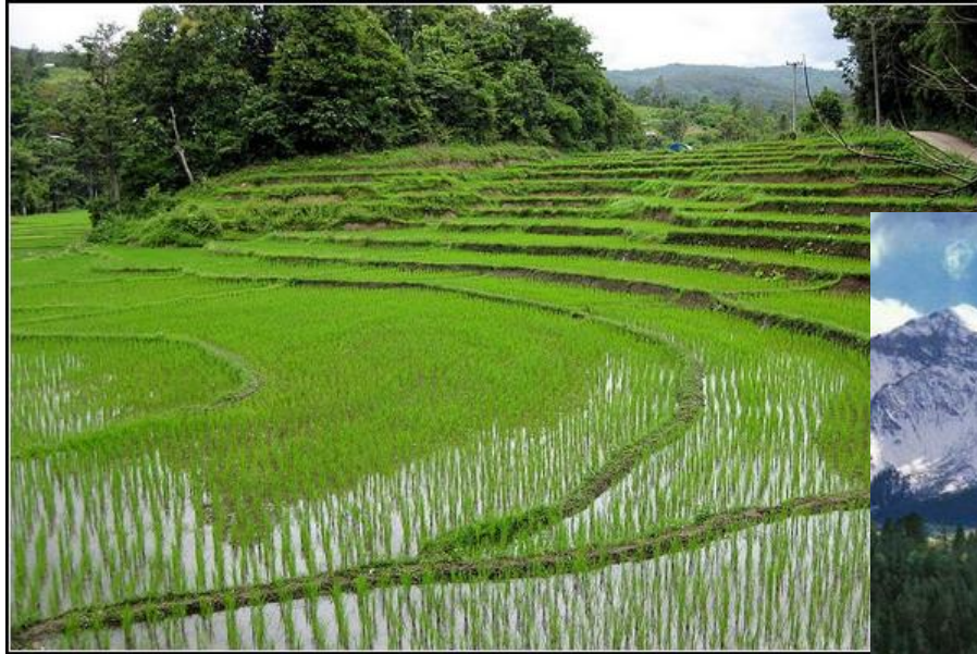
Заброшенные рисовые поля Японии