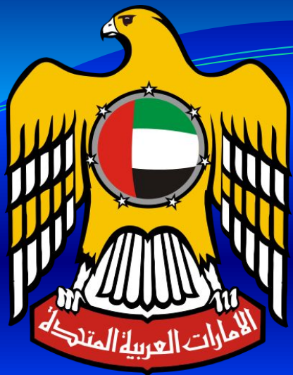
Герб Объединенных Арабских Эмиратов