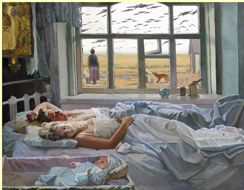
Картина В.Папко: «Даже не снилось. 22 июня 1941»