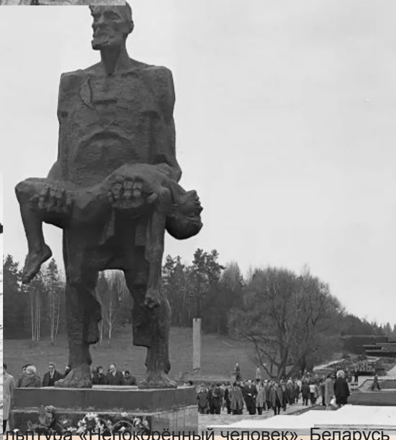
Скульптура «Непокорённый человек», Беларусь