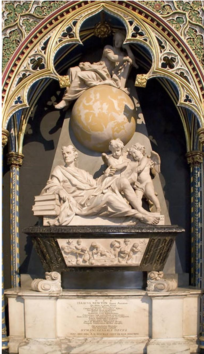
Рис.5 Могила Ньютона

В Кенсингтон неподалёку от Лондона, скончался ночью, во сне, 20 марта 1727 года, похоронен в Вестминстерском аббатстве.