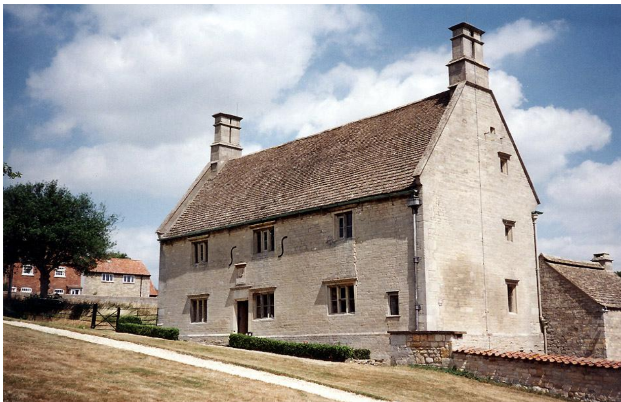
Рис.2 Дом семьи Ньютона.

Исаак родился 25 декабря 1642 в деревне Вулсторп, графство Линкольншир.