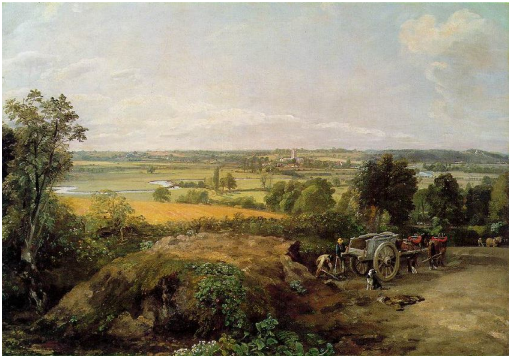
Долина реки Стур с дедхемской церковью . 1814

Констебл создал большую серию пейзажей с видами реки Стур