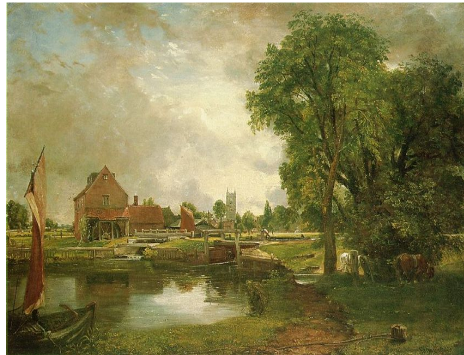
Плотина и мельница в Дедхеме (Дедхемская мельница)

На переднем плане художник поместил притягивающую взгляд фигуру мальчика, сидящего на лошадке. На картине царит редкостное спокойствие. Почти аркадианская безмятежность бытия, доступная всем и каждому.