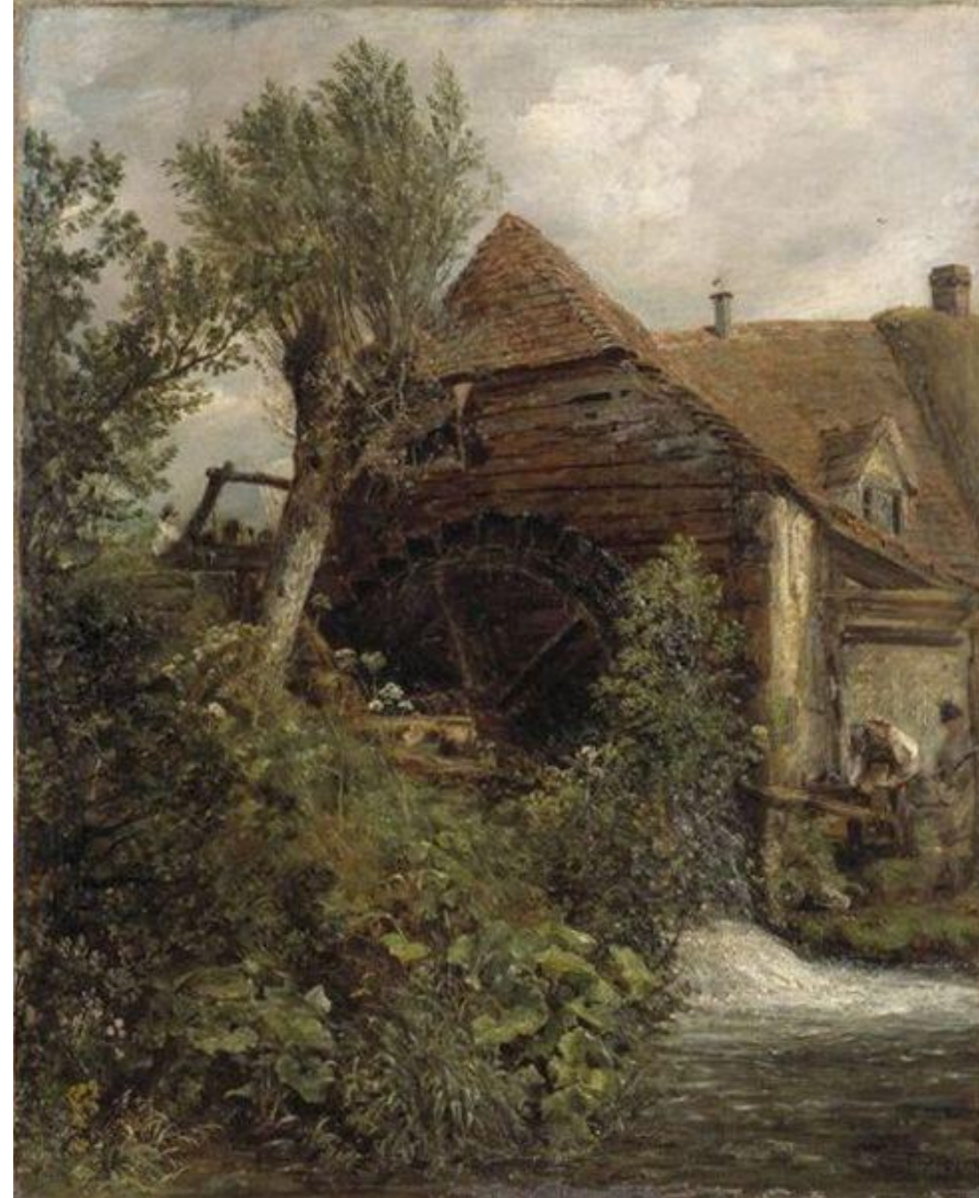
Водяная мельница в Гилленгеме. 1823 г

Насколько разнообразным и тонким колористом был Констебл, можно судить по изображению зелени на этой картине.