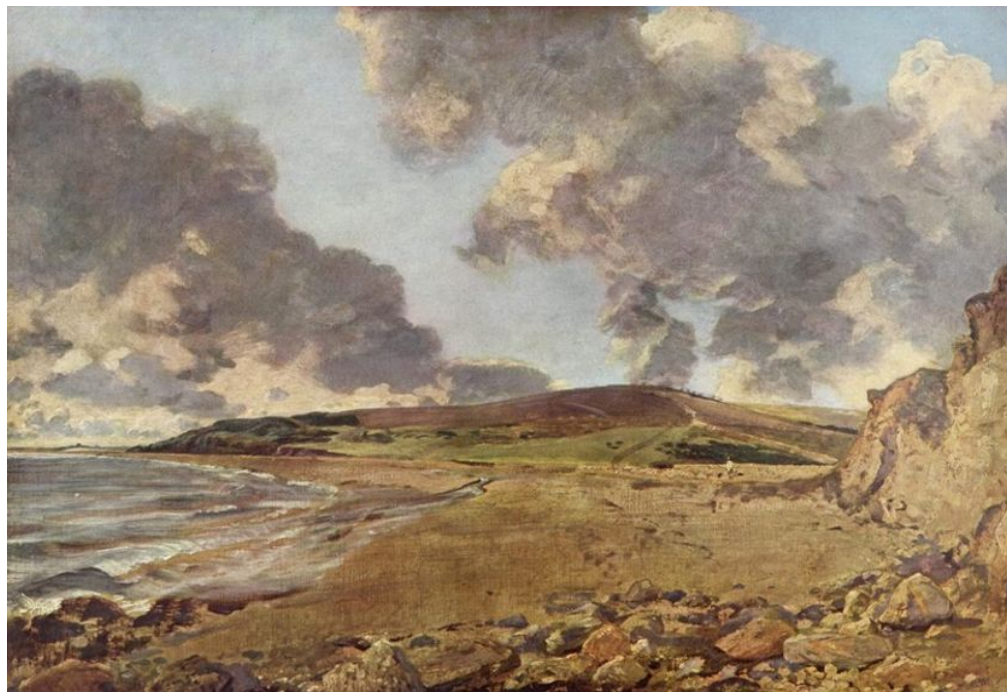
«Залив Веймут с горой Джордан»

В своих работах Констебл предстает смелым и независимым мастером, его принципиально новая трактовка природы не соответствует нормам академического искусства. По мнению художника, основой изображения должно быть наблюдение, а лейтмотивом любого пейзажа — небо . Следуя традиции голландских мастеров, художник стремится к воссозданию атмосферы, облаков и света.