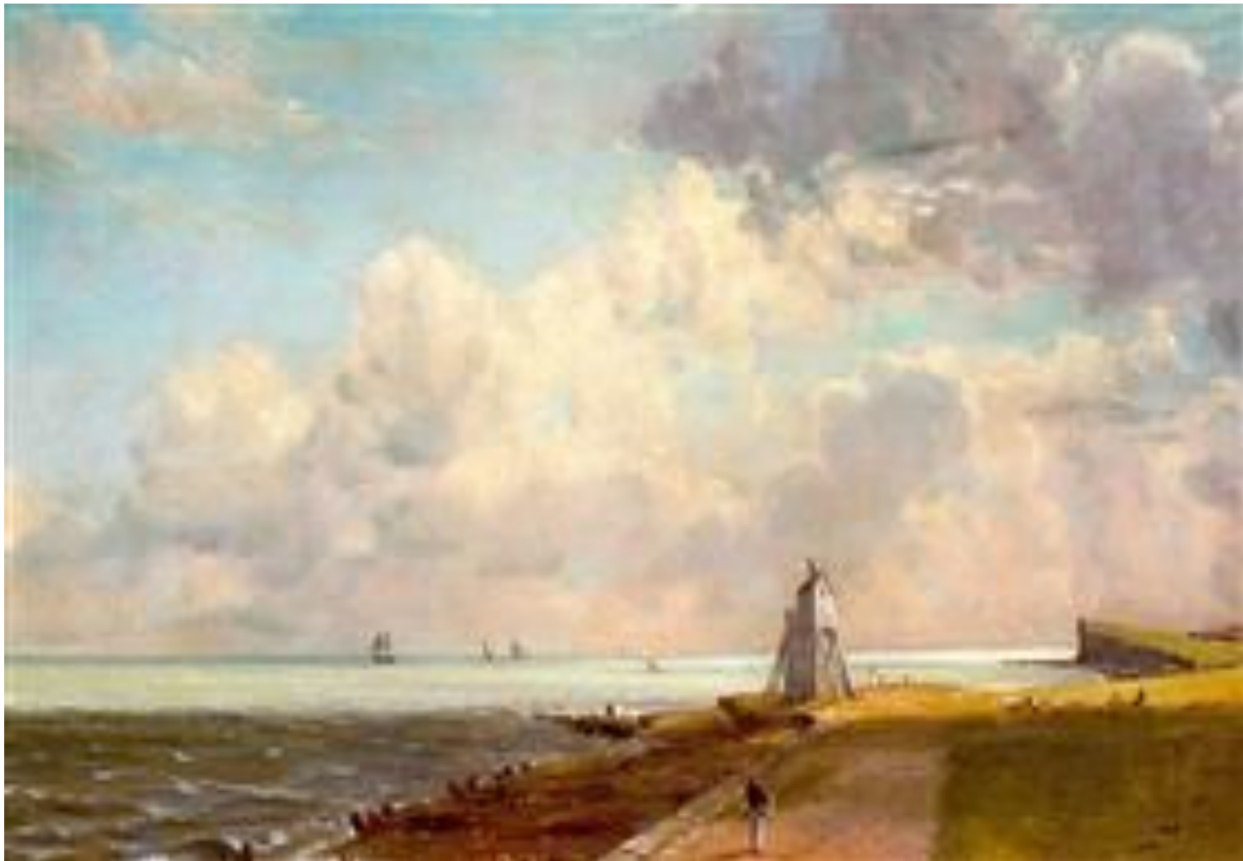
Низкий маяк Бикон-Хилл