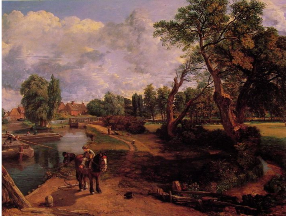
Флэтфордская мельница (Сцена на судоходной реке)

На переднем плане художник поместил притягивающую взгляд фигуру мальчика, сидящего на лошадке. На картине царит редкостное спокойствие. Почти аркадианская безмятежность бытия, доступная всем и каждому.