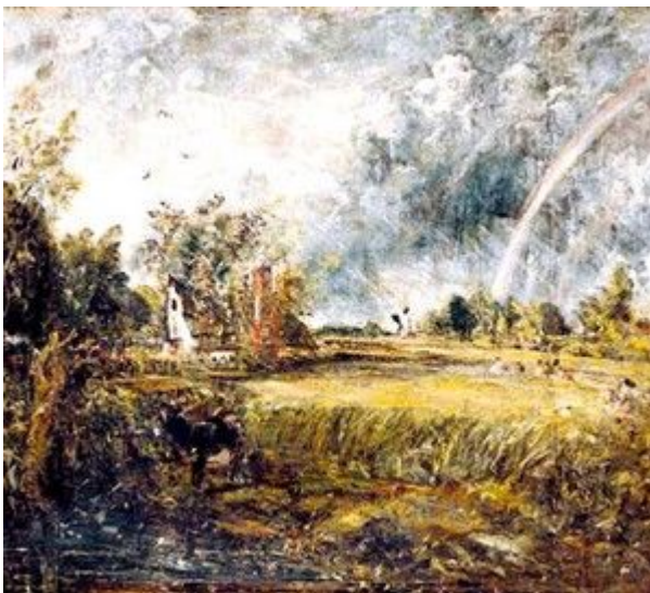
Дом, радуга, мельница

Вместе с тем Констебл оказал заметное влияние на французскую романтическую живопись с ее свободой исполнения и сыграл важную роль в формировании Барбизонской школы, а его энергичная манера живописи и умение создать особое настроение, используя свет, вдохновили художников-импрессионистов, которые унаследовали от него интерес к переменчивым состояниям природы.