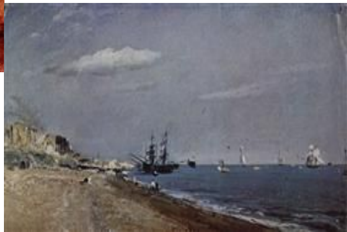
Морское побережье в Брайтоне