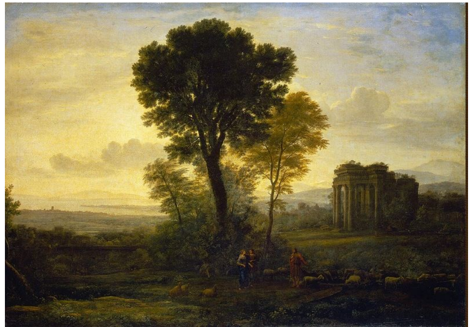
Клод Лоррен «Агарь и ангел».