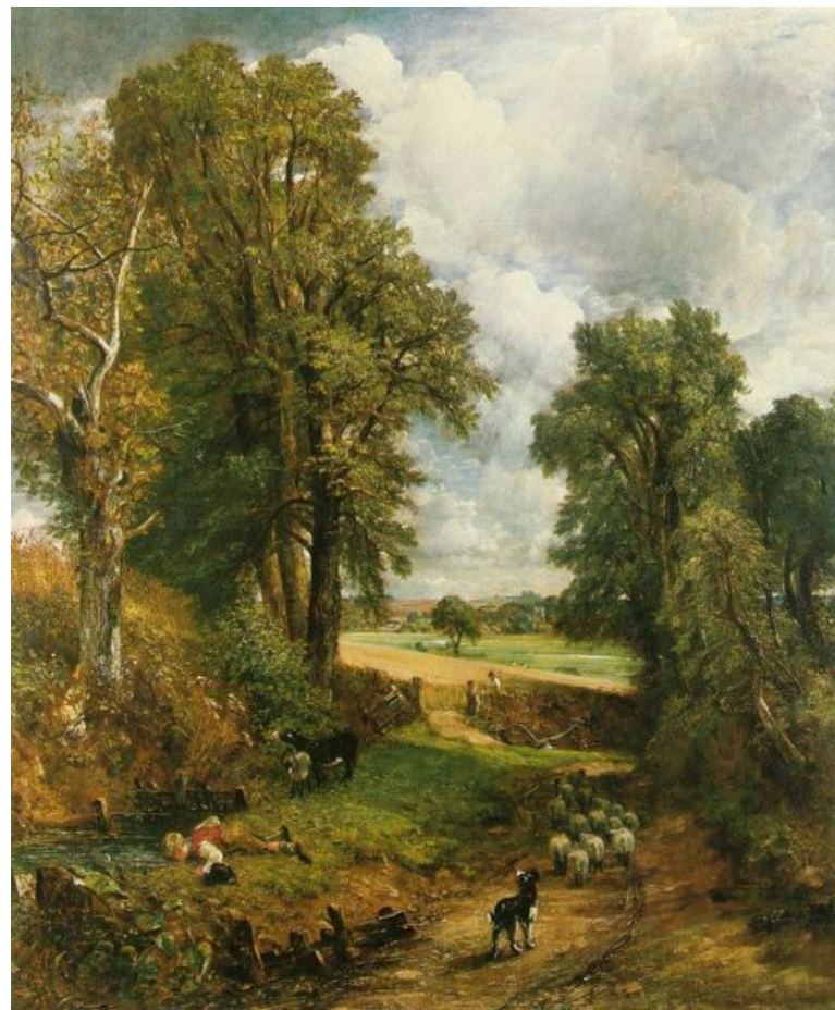
Кукурузное поле . 1826