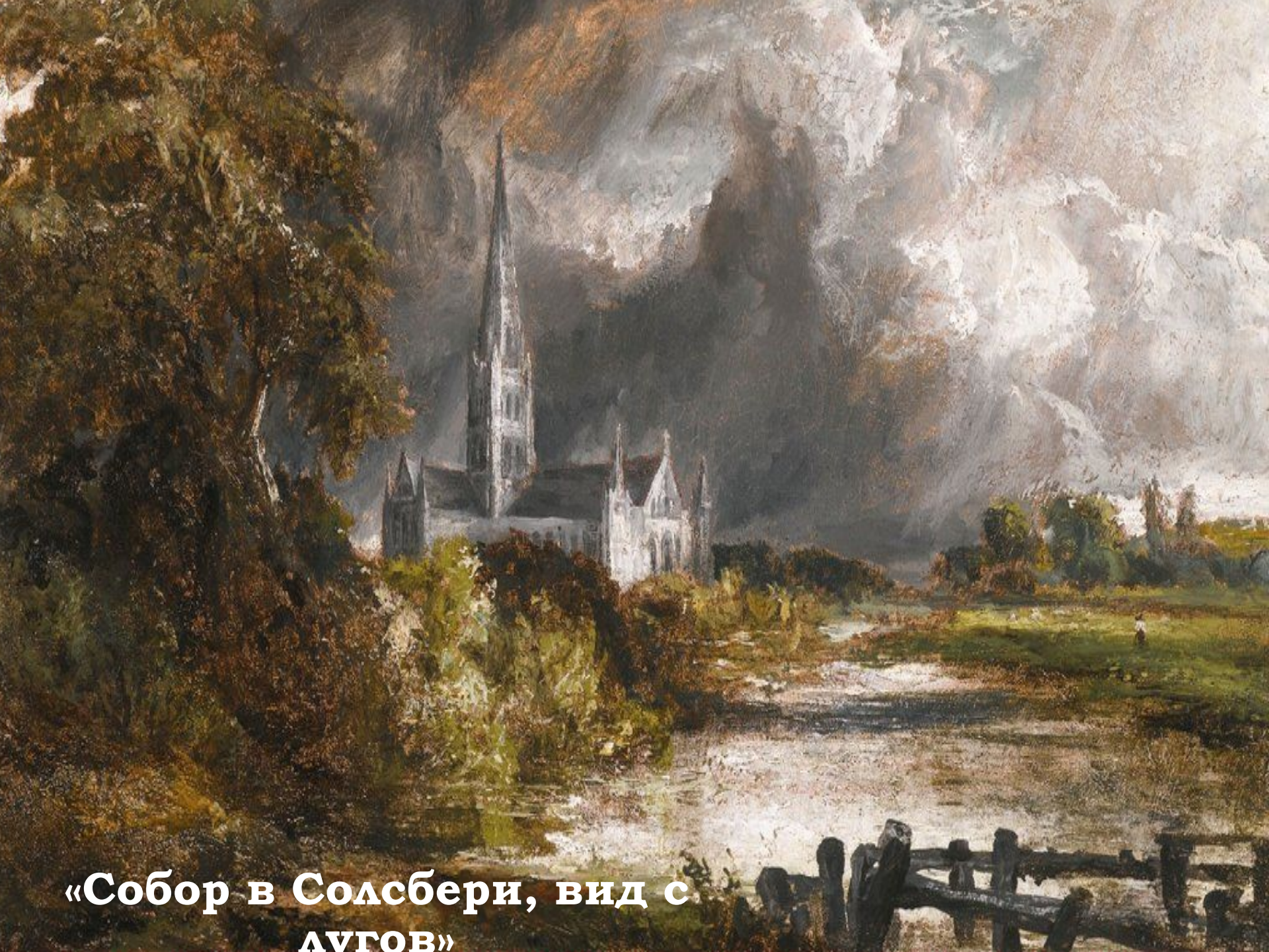
«Собор в Солсбери, вид с ЛУГОВ»