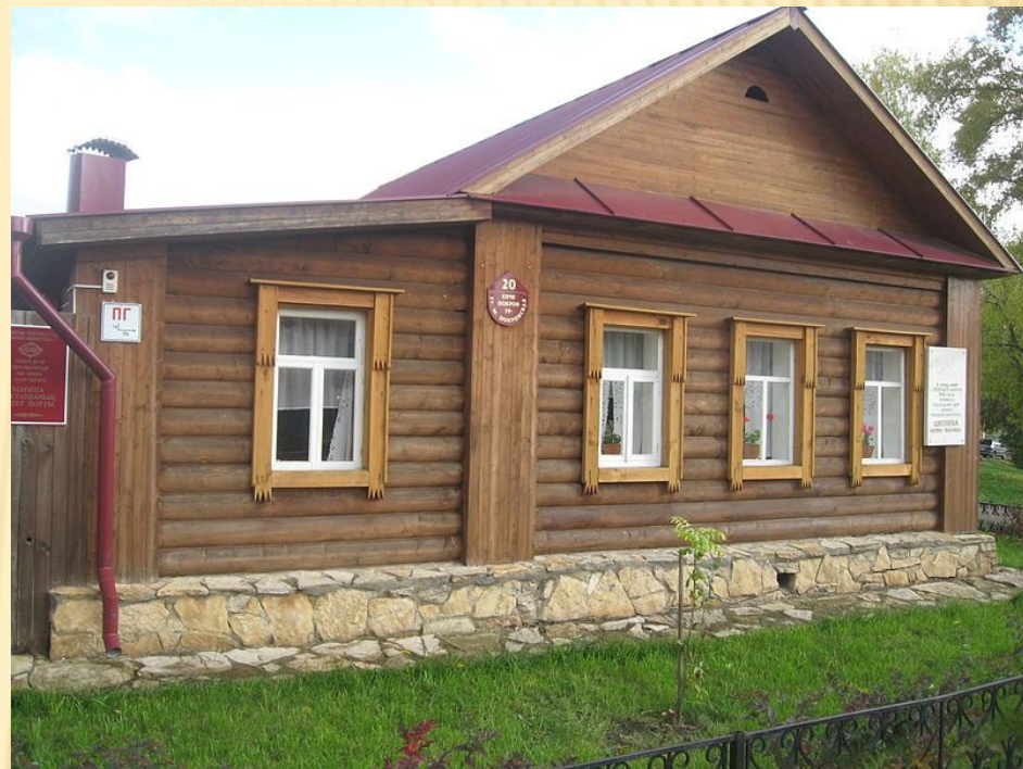
Дом Бродельщиковых в Елабуге, где ушла из жизни Марина Цветаева