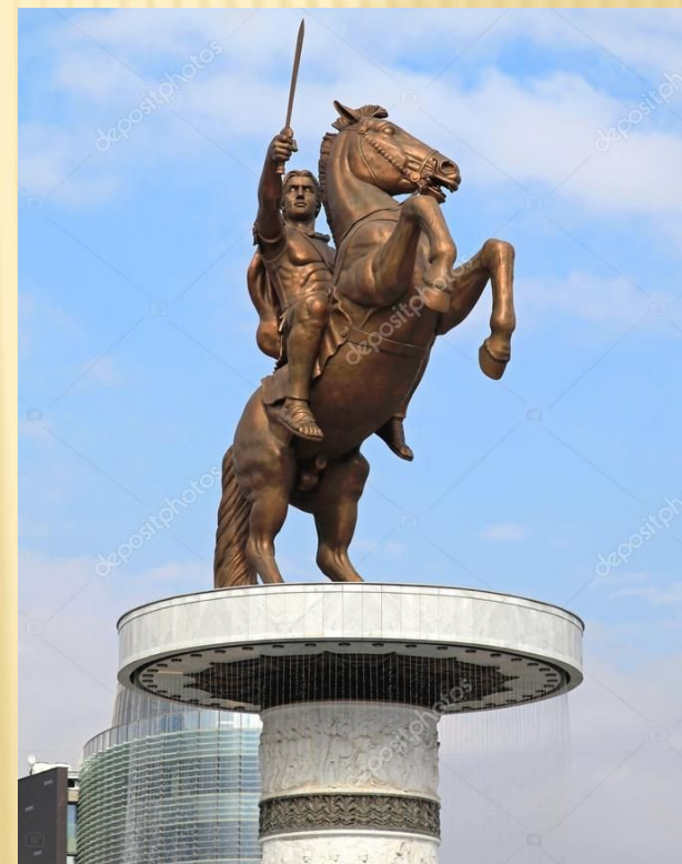
«Человек на лошади»