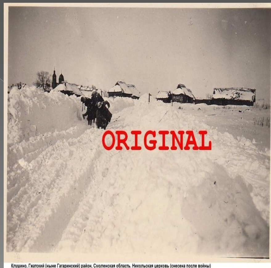
Клушино, Гжатский (ныне Гагаринский) район, Смоленская область. Никольская церковь (снесена после войны)