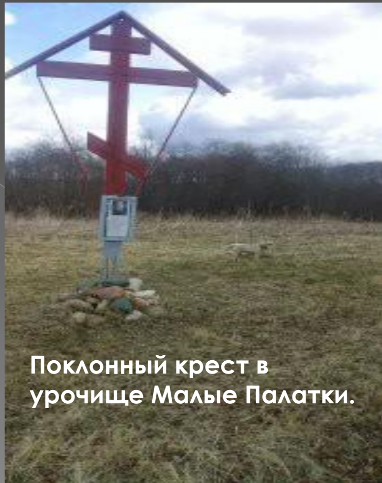
Поклонный крест в урочище Малые Палатки.