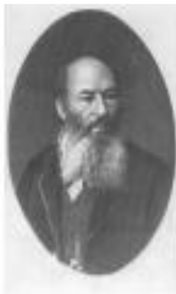
A. A. Fet Мин. Государств. Деп. 1880. 1880. 1880.