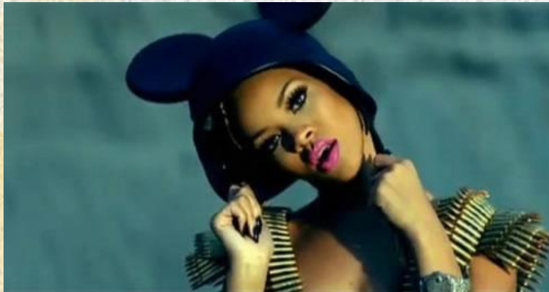
Ріанна у фільмі

Ріанна взяла участь у зйомках фільму Пітера Берга — Морський бій (2012). Однак обидва, як фільм, так і саме виконання ролі співачки, виявились провальними. За це вона виграла в номінації на Золоту малину за Найгіршу жіночу роль другого плану, але отримала нагороду в номінації Вибір Підлітків.