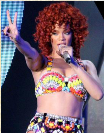
Виступ Ріанни в рамках Loud Tour

В січні Ріанна виграла дві нагороди на церемонії Barbados Music Awards в номінаціях «Артист десятиліття» й «Пісня десятиліття» за композицію «Umbrella». На церемонії NRJ Music Awards вона отримала титул «Міжнародної співачки року». Протягом літа Ріанна і репер Емінем працювали над піснею «Love the Way You Lie», яка пізніше стала хітом #1 в чарті США Billboard Hot 100. В серпні воскова фігура Ріанни була представлена в Музеї мадам Тюссо в Вашингтоні. 16 листопада 2010 року Ріанна випустила п'ятий студійний альбом Loud, який зайняв третє місце в чарті Billboard 200 з продажами 207 000 копій за перший тиждень, що являється найкращим результатом тижневих альбомних продажів в кар'єрі Ріанни. Протягом місяця співачка з'явилась в якості запрошеного члена журі на американському реаліті-шоу X-Фактор.