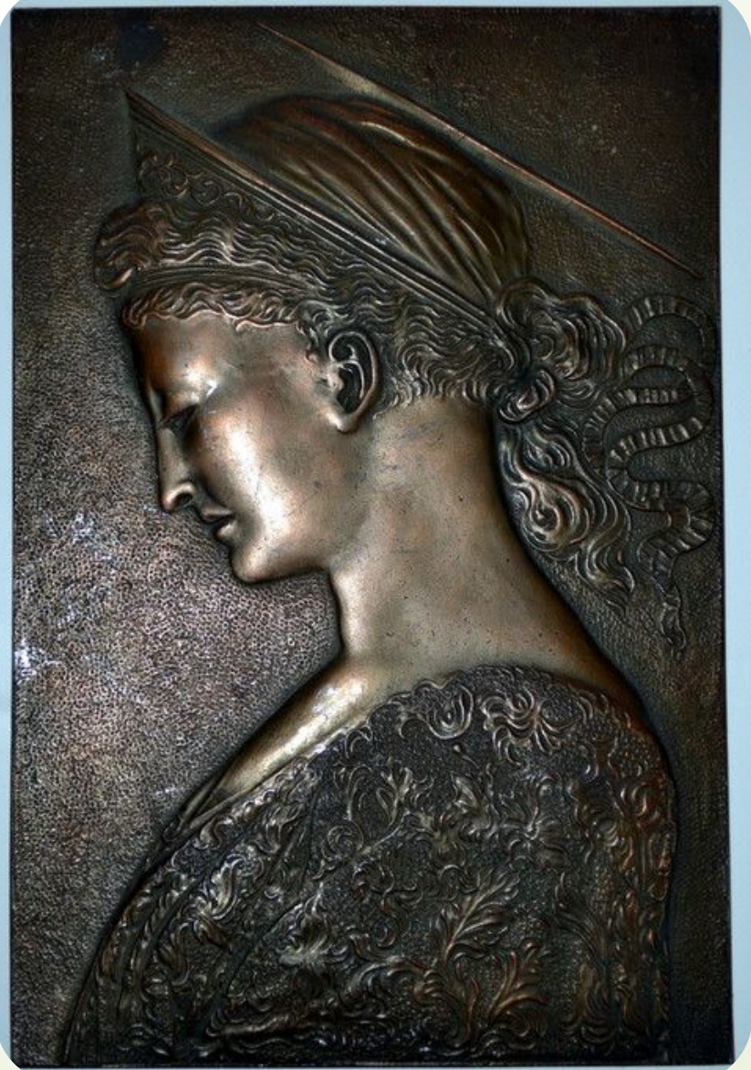
Рельеф св. Цецилии