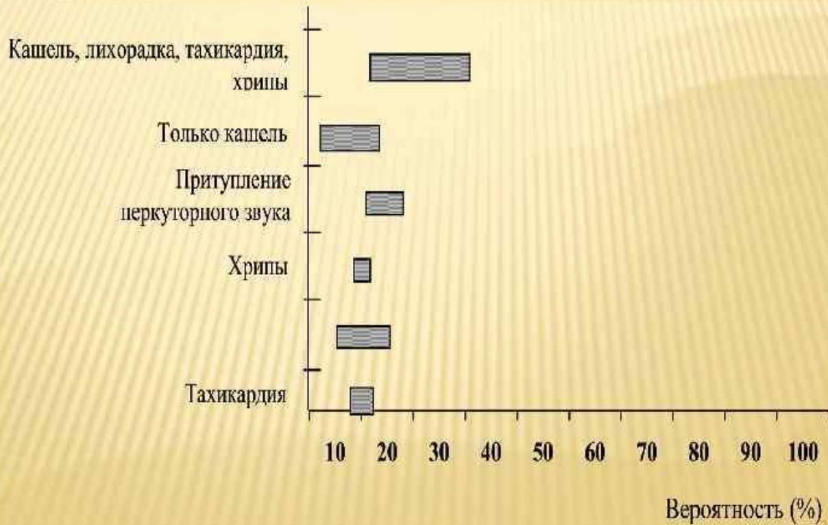
ВЕРоятность ДИАГНОСТИКИ ВП ПО ДАННЫМ КЛИНИЧЕСКОГО ОБСЛЕДОВАНИЯ [J.P.METLAY, M.J.FINE, 2003]