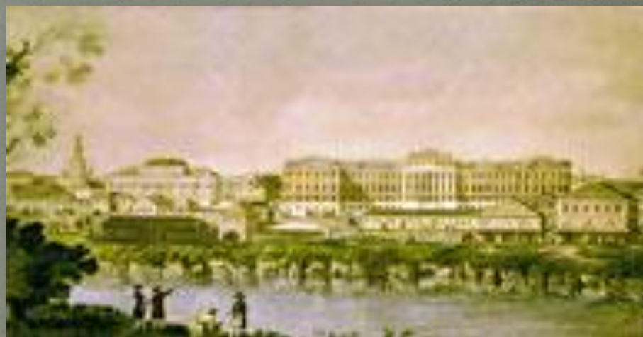
Здание университета 1786 г.

В соответствии с планом М.В. Ломоносова в Московском университете были образованы 3 факультета: философский, юридический и медицинский. Свое обучение все студенты начинали на философском факультете, где получали фундаментальную подготовку по естественным и гуманитарным наукам. Образование можно было продолжить, специализируясь на юридическом, медицинском или на том же философском факультете.