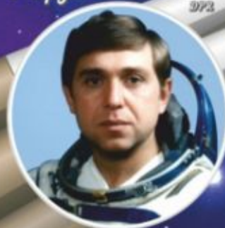
А.А. ВОЛКОВ Космонавт, Донбасс