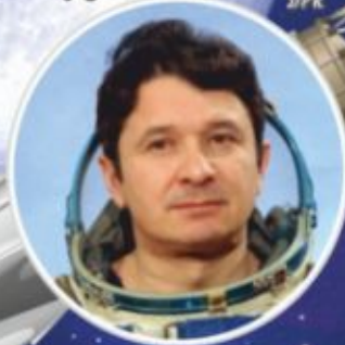
А.Д. КИЗИМ Космонавт, Донбасс