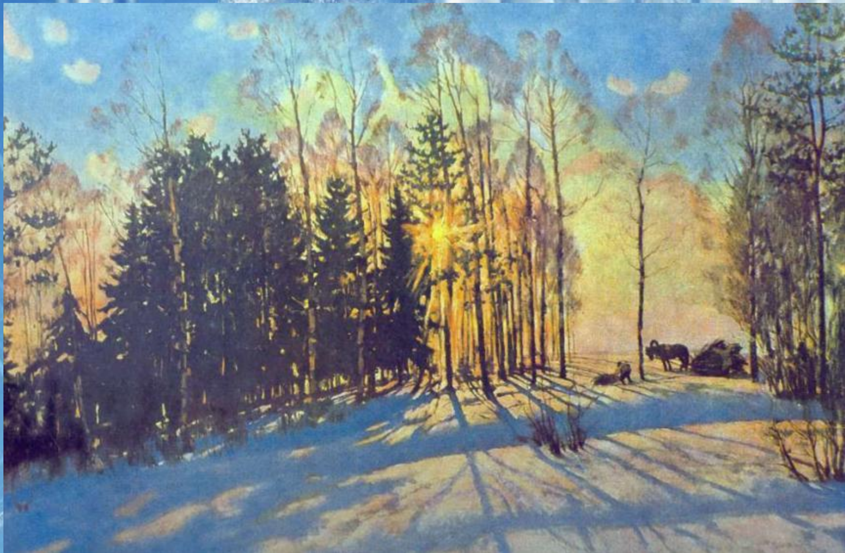
«Зимнее солнце. Лигачёво» 1916