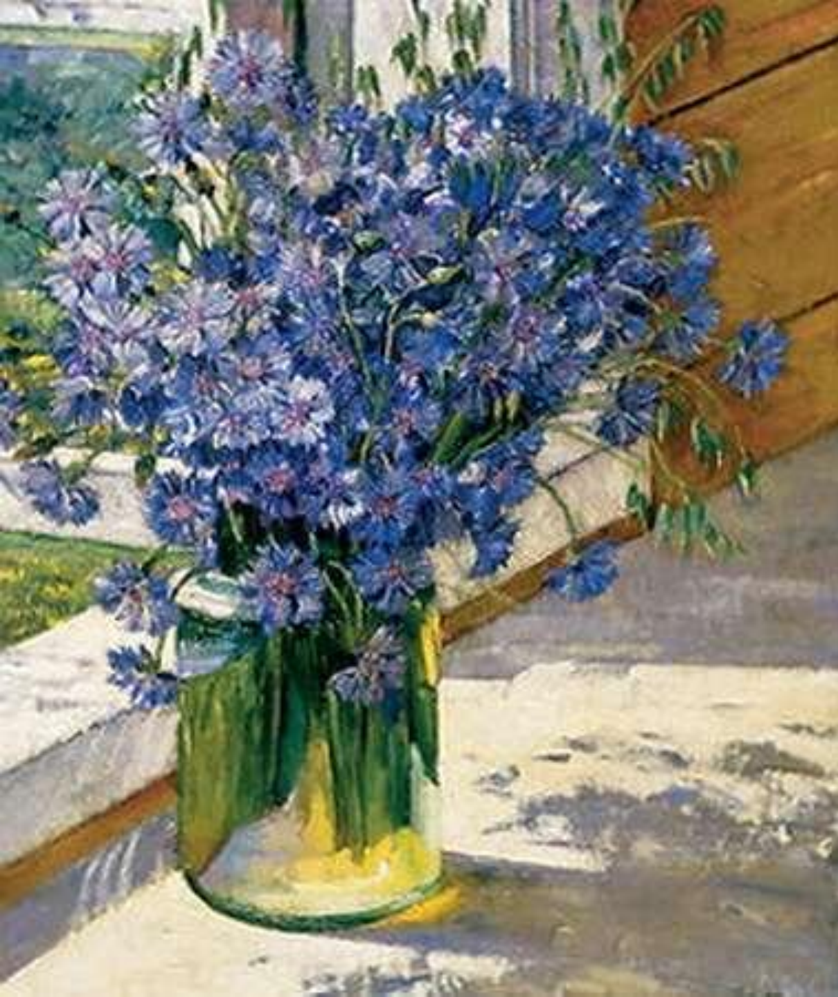
Натюрморт «Васильки в луче солнца» 1930