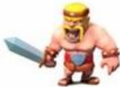
Уровень 3 и 4