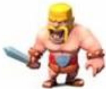
Уровень 1 и 2

Во время уничтожения вражеской деревни этот бесстрашный воин полагается на свои огромные мускулы и сногшибательные усы. Отправьте в бой толпу варваров и наслаждайтесь