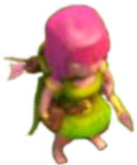
Уровень 1 и 2