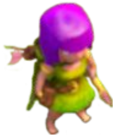
Уровень 3 и 4