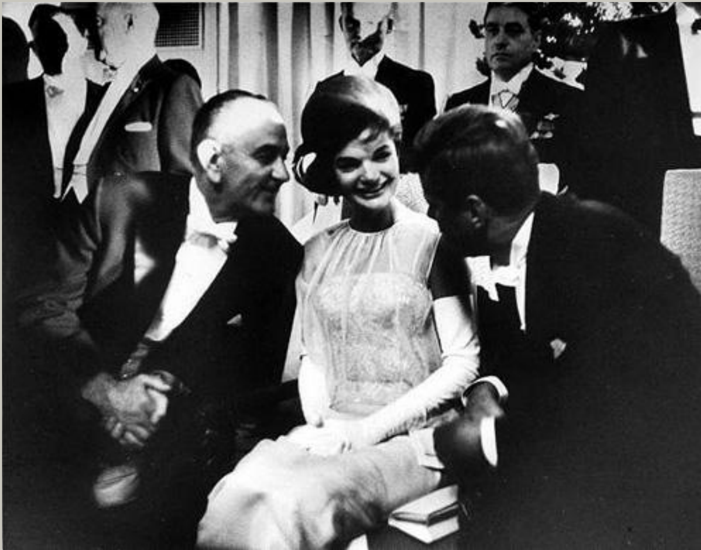
Жаклин Кеннеди в окружении мужчин