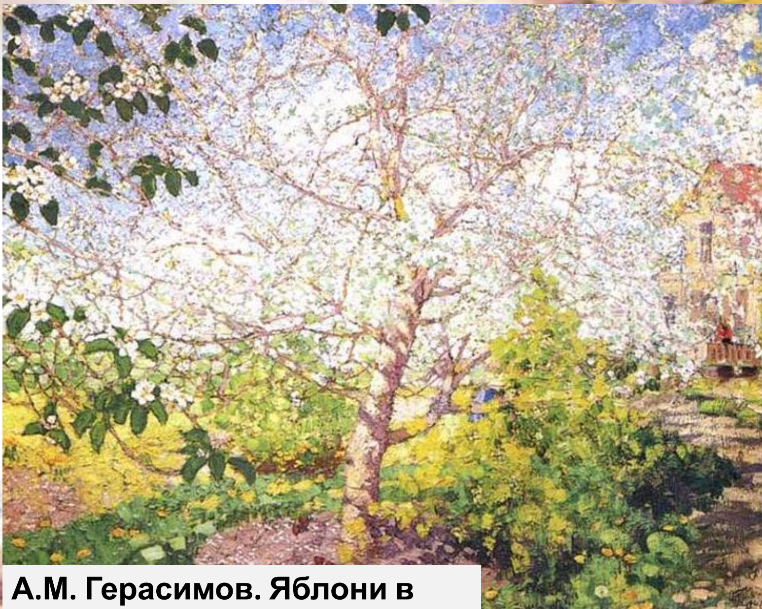
А.М. Герасимов. Яблони в цвету.