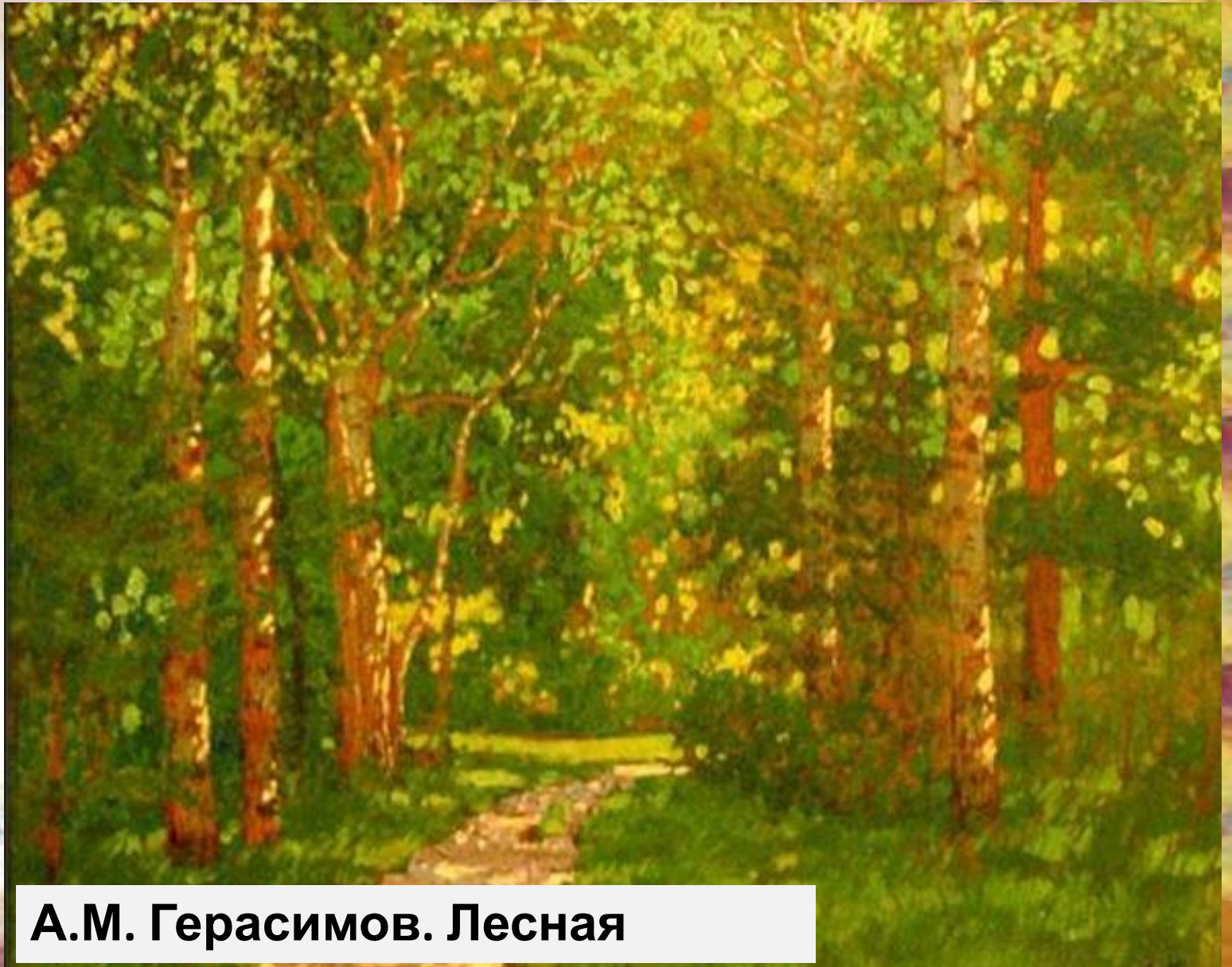
А.М. Герасимов. Лесная тропинка