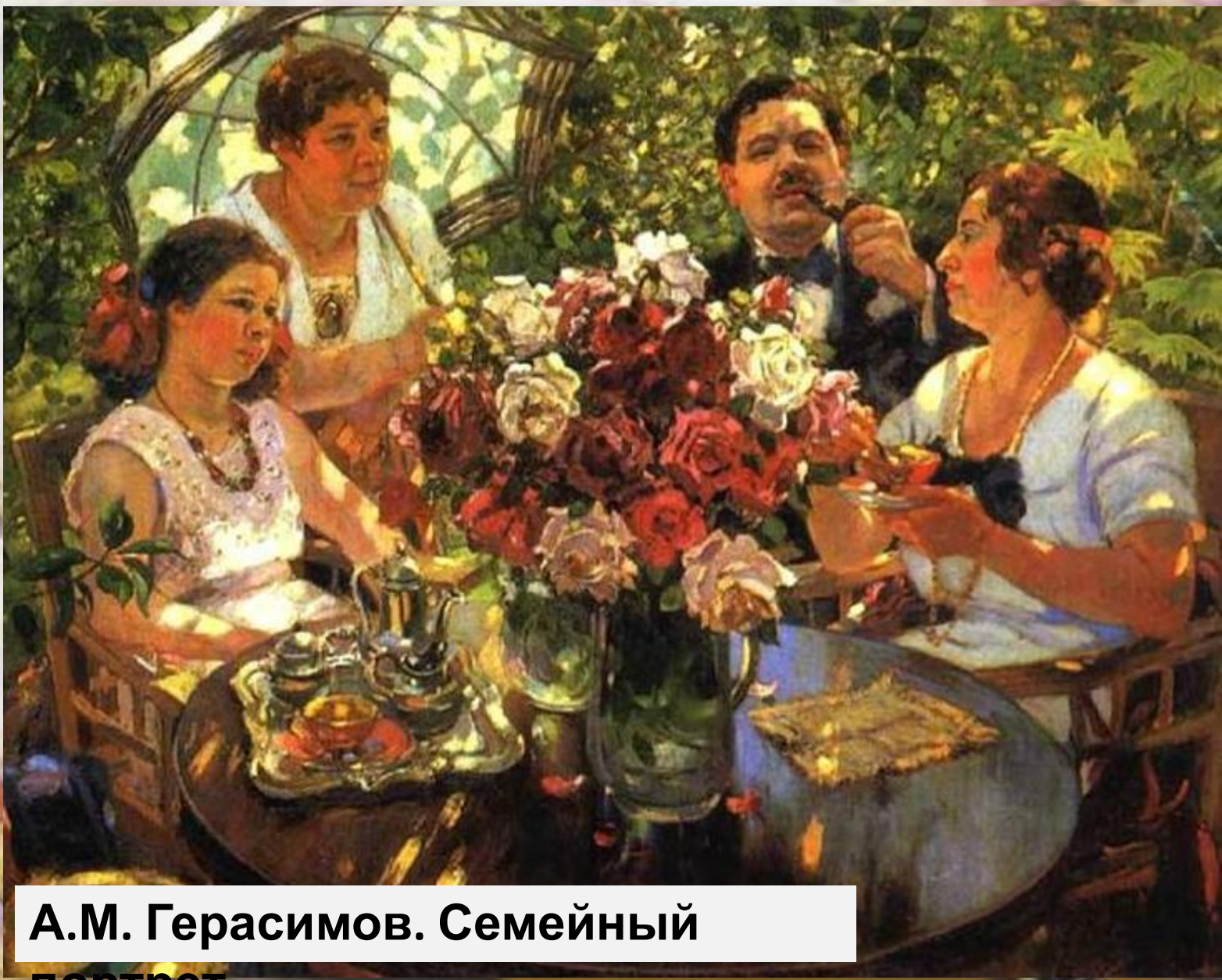
А.М. Герасимов. Семейный портрет.