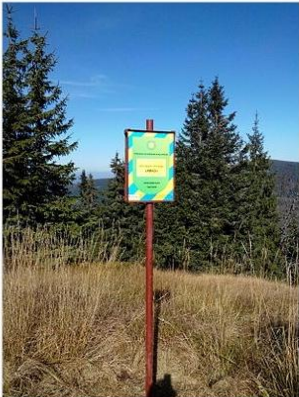
Охоронний знак з боку полонини Довге Поле