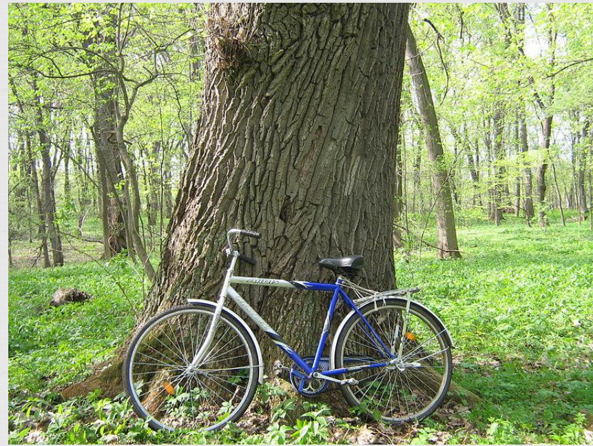
Дуб в урочищі. Обхват стовбура — 464 см на висоті 1,3 м від землі (2011 рік)