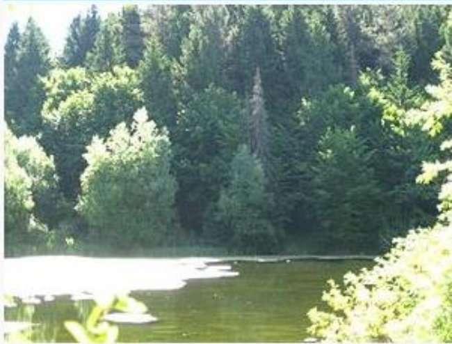
Став в урочищі «Круглик»