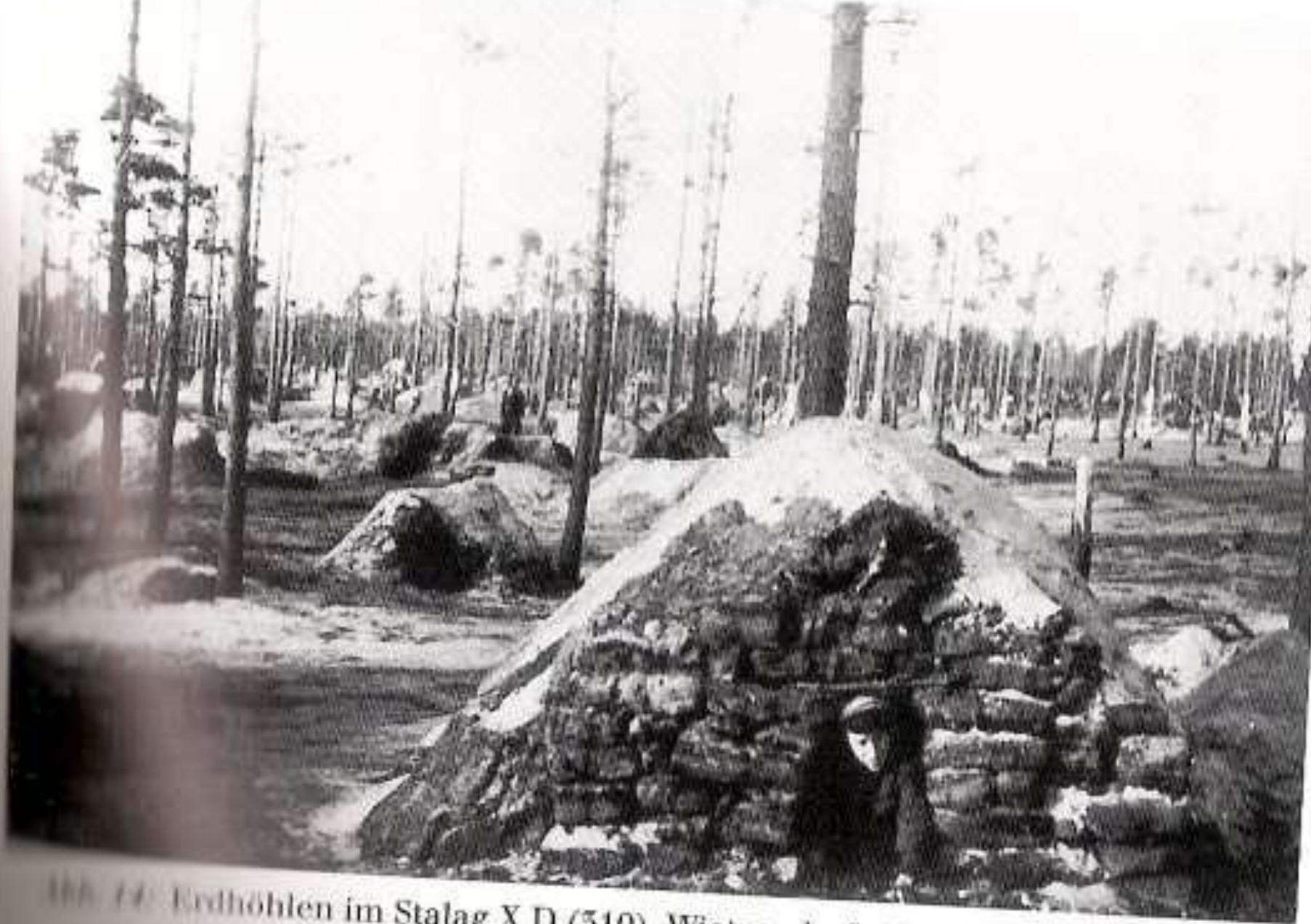
Abb. 10: Erdhöhlen im Stalag X D (310), Wietzendorf, 1941.